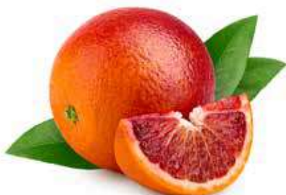
ARANCE ROSSE TAROCCO DI SIRACUSA