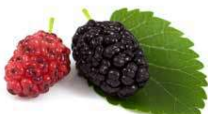
GELSI NERI DELL'ETNA