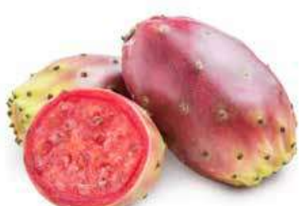
FICHI D'INDIA SICILIANI