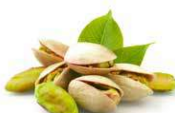
PISTACCHI DI RAFFADALI