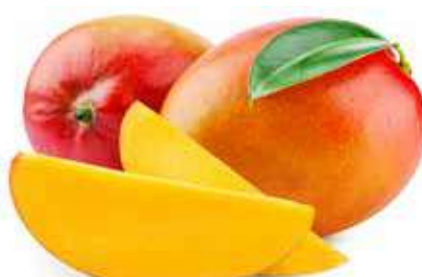
MANGO DI ACIREALE