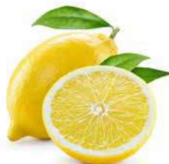
LIMONI GIALLI FEMMINELLO DI SIRACUSA