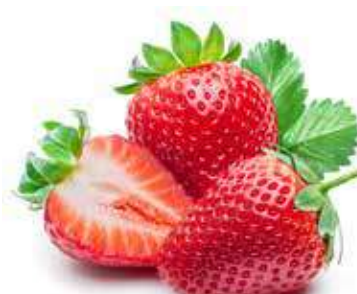
FRAGOLE DI MALETTO

Vellutate scagliette di Spremuta di Frutta e acqua di sorgente, dal gusto intenso, morbido, avvolgente.