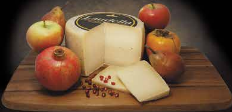
3465 - BELLA LODI FORMAGGELA LAUDELLA PESO 3 kg