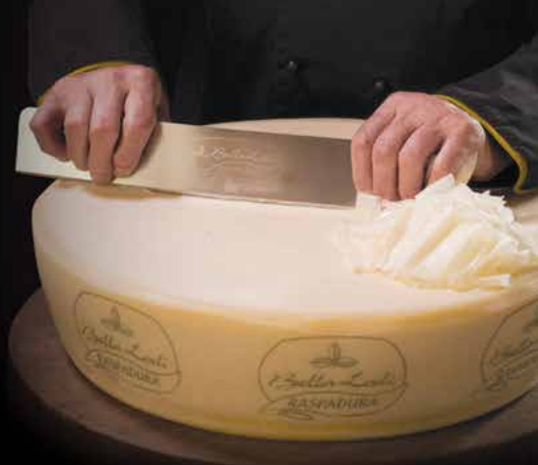
5080 - GRANA DOP A SCAGLIE PESO 500 g