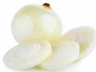
CIPOLLE A CUBETTI PESO 2 kg - 2 BUSTE PER CONFEZIONE