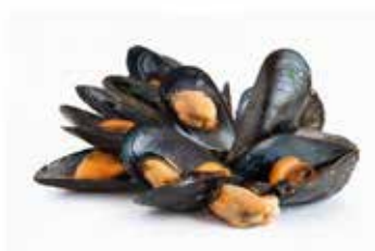
COZZE CON GUSCIO PESO 1 kg