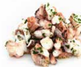
INSALATA DI MARE CRUDA