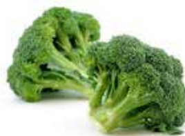
BROCCOLI VERDI PESO 2 kg - 2 BUSTE PER CONFEZIONE