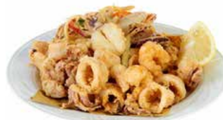
GRAN FRITTO MARE PASTELLATO