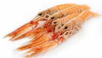
SCAMPI INTERI PESO 1 kg