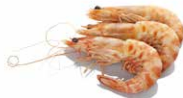
GAMBERI INTERI PESO 2 kg