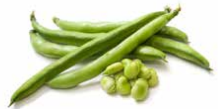
FAVE PESO 1 kg PER CONFEZIONE