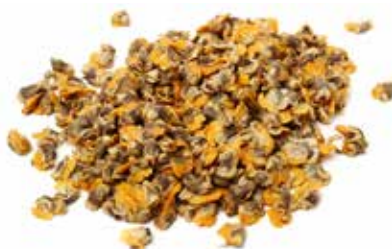
VONGOLE SGUSCIATE PESO 1 kg