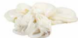
SEPIOLINE PULITE PESO 1 kg