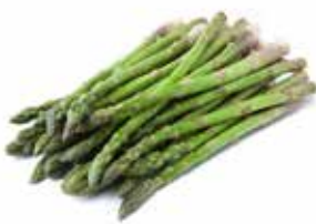
ASPARAGI PUNTE PESO 500 g - 12 BUSTE PER CONFEZIONE