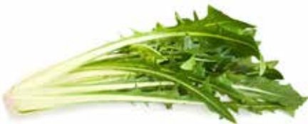
CICORIA PESO 2 kg - 2 BUSTE PER CONFEZIONE