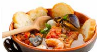
ZUPPA DI PESCE CRUDA