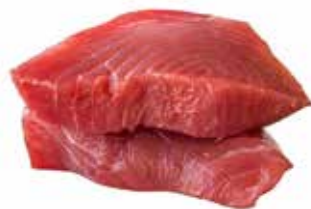
TRANCIO TONNO PINNA GIALLA