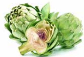
CARCIOFI A SPICCHI PESO 2,5 kg - 2 BUSTE PER CONFEZIONE