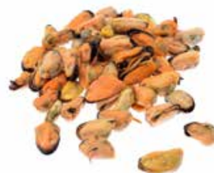
COZZE SGUSCIATE PESO 1 kg