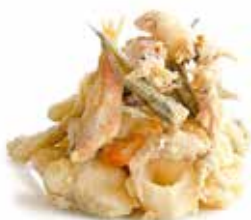
GRAN FRITTO MARE CRUDO