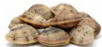
VONGOLE CON GUSCIO PESO 1 kg