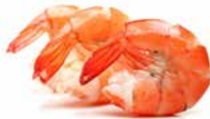
CODE DI GAMBERI PESO 1 kg