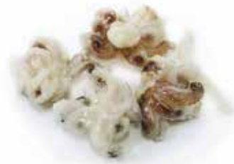
CIUFFI DI CALAMARI