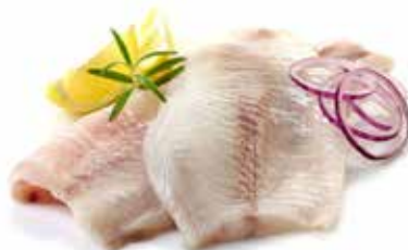
FILETTI DI ORATA