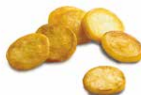
PATATE A FETTE SAUTEES PESO 10 kg - 4 BUSTE PER CONF.