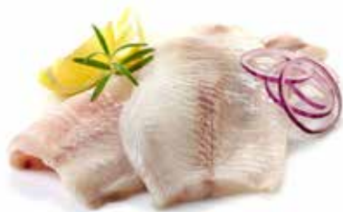
FILETTI DI ORATA