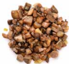
MISTO FUNGHI PESO 6 kg - 6 BUSTE PER CONF.