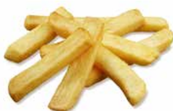
PATATE STEAK HOUSE SUPERCRUNCH PESO 12,5 kg - 5 BUSTE PER CONF.