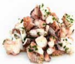
INSALATA DI MARE