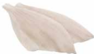
FILETTI DI PLATESSA