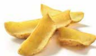
PATATE FRY'N DIP CON BUCCIA PESO 12,5 kg - 5 BUSTE PER CONF. PATATE FRY'N DIP PESO 12,5 kg - 5 BUSTE PER CONF.