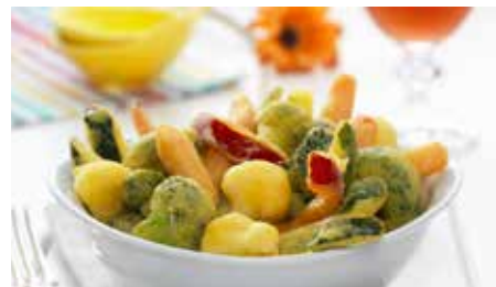
FRITTO MISTO DELL'ORTO PESO 5 kg - 2 BUSTE PER CONF.