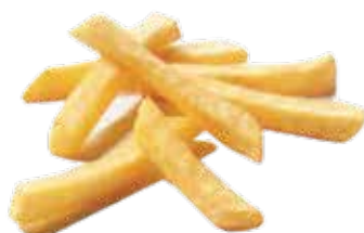
PATATE FRITTE PESO 12,5 kg - 5 BUSTE PER CONF.