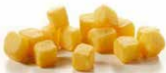
PATATE A CUBETTONI BRAVAS PESO 10 kg - 4 BUSTE PER CONF.