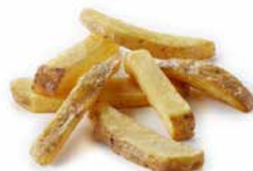
PURE & RUSTIC PESO 10 kg - 4 BUSTE PER CONF.