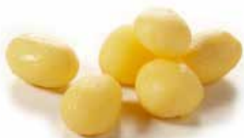
PATATE NOVELLE PESO 10 kg - 4 BUSTE PER CONF.