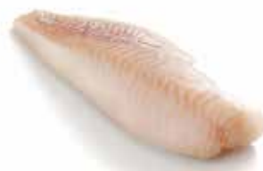
FILETTI DI MERLUCCIO