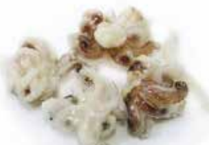
CIUFFI DI CALAMARI