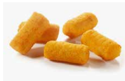
CROCCHETTE DI PATATE PESO 10 kg - 4 BUSTE PER CONF.