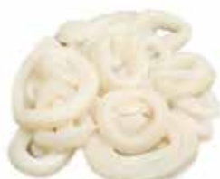
ANELLI DI TOTANO