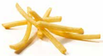
PATATE SUPERCRUNCH 7MM PESO 10 kg - 4 BUSTE PER CONF.