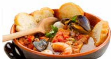
ZUPPA DI PESCE CRUDA