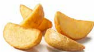
PATATE A SPICCHI CON BUCCIA PESO 10 kg - 4 BUSTE PER CONF.