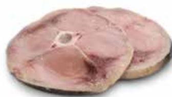
TRANCIO PESCE SPADA