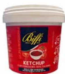
SECCHIELLO KETCHUP BIFFI 2998 PESO 5 kg