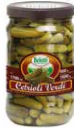
CETRIOLI BELOTTI PESO 1,7 kg - IN VETRO