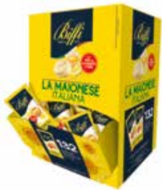
MAIONESE IN BUSTINE BIFFI 3177 10 ml - 132 PZ. PER CONFEZIONE