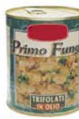
FUNGHI CHAMPIGNON TRIFOLATI IN OLIO DI OLIVA PESO 0,8 kg - IN LATTA