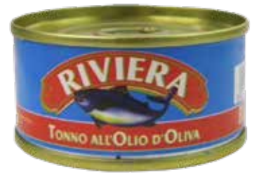
TONNO ALL'OLIO DI OLIVA RIVIERA PESO 80 g - 12 PZ. PER CONF.