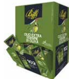
OLIO DI OLIVA IN BUSTINE BIFFI 3181 10 ml - 102 PZ. PER CONFEZIONE