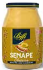
SENAPE BIFFI 960 ml - VASO