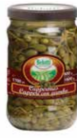
CAPPERI CON GAMBO BELOTTI PESO 1,7 kg - IN VETRO