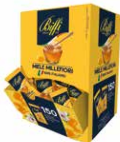
MIELE IN BUSTINE BIFFI 3179 4 ml - 150 PZ. PER CONFEZIONE