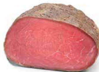
ROASTBEEF MANZO ALL'INGLESE MEZZO