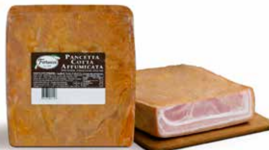
PANCETTA COTTA AFFUMICATA BACON MEZZA PESO 2,5 kg