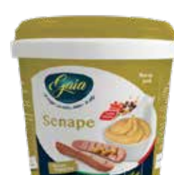
SECCHIELLO SENAPE BIFFI 3161 PESO 5 kg