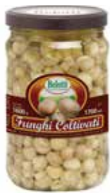
FUNGHI COLTIVATI INTERI IN OLIO BELOTTI PESO 1,7 kg - IN VETRO