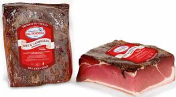
SPECK CAMPIGLIO MEZZO