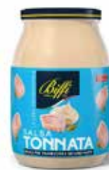
SALSA TONNATA BIFFI 960 ml - VASO