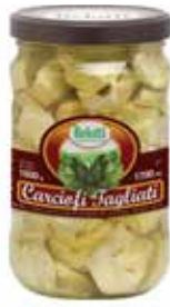
CARCIOFI TAGLIATI BELOTTI PESO 1,7 kg - IN VETRO