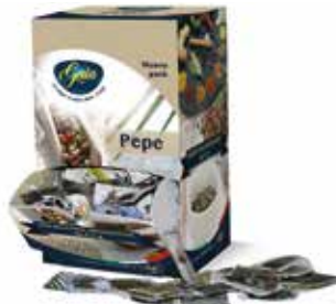
PEPE IN BUSTINE BIFFI 3185 0,2 g - 500 PZ. PER CONFEZIONE