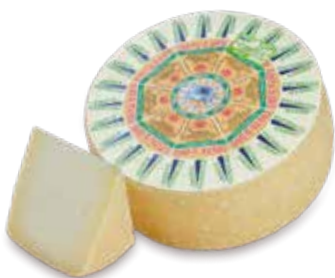
PECORINO SARDO DOLCE DOP