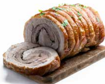
ARROSTO DI VITELLO COTTO MEZZO