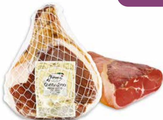
PROSCIUTTO CRUDO CONTADINO INTERO PESO 7 kg