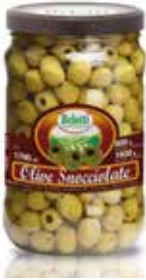
OLIVE VERDI SNOCCIOLATE BELOTTI PESO 1,7 kg - IN VETRO