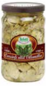
CARCIOFI A SPICCHI ALLA VILLANELLA BELOTTI PESO 1,7 kg - IN VETRO