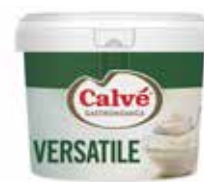
SECCHIELLO MAIONESE VERSATILE CALVÈ 3117 PESO 2 kg