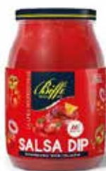
SALSA DIP MESSICANA BIFFI 1062 ml - VASO