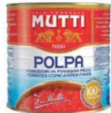
POLPA FINE DI POMODORO MUTTI PESO 5 kg - IN LATTA