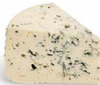
GORGONZOLA DOP MARCA STELLA PESO 1 kg