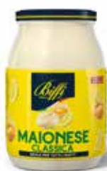
MAIONESE BIFFI 960 ml - VASO