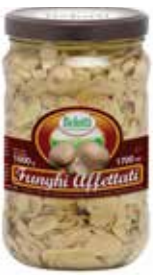
FUNGHI COLTIVATI TAGLIATI IN OLIO BELOTTI PESO 1,7 kg - IN VETRO