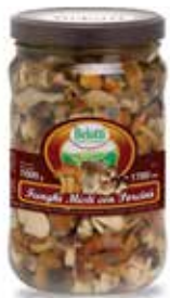
MISTO FUNGHI CON PORCINI IN OLIO BELOTTI PESO 1,7 kg - IN VETRO