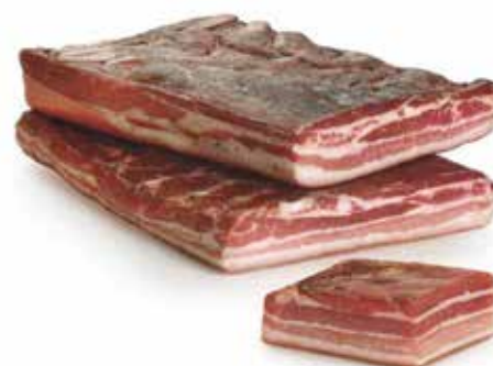
PANCETTA TESA AMATRICIANA MEZZA PESO 1,8 kg