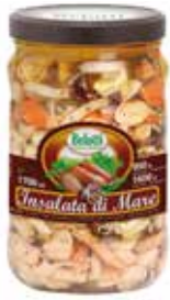
INSALATA DI MARE BELOTTI PESO 1,7 kg - IN VETRO