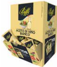
ACETO IN BUSTINE BIFFI 3182 5 ml - 198 PZ. PER CONFEZIONE