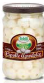
CIPOLLE IN AGRODOLCE BELOTTI PESO 1,7 kg - IN VETRO