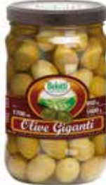
OLIVE VERDI GIGANTI BELOTTI PESO 1,7 kg - IN VETRO