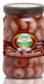
CIPOLLINE BORETTANE BELOTTI PESO 1,7 kg - IN VETRO