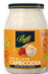
SALSA CAPRICCIOSA BIFFI 980 ml - VASO