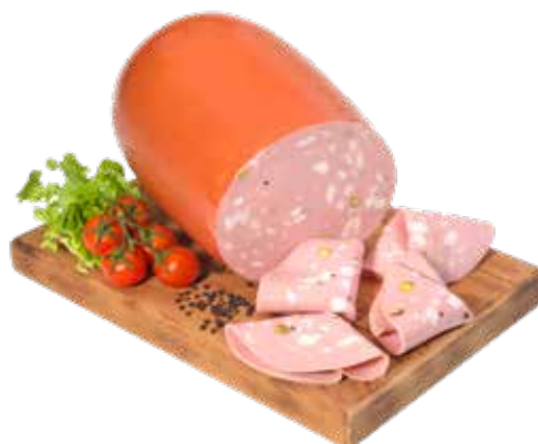
MORTADELLA SPECIALE BRIVIO MEZZA