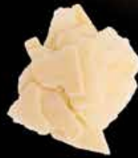
5080 - GRANA DOP A SCAGLIE PESO 500 g