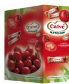
KETCHUP IN BUSTINE CALVÈ 3110 15 ml - 200 PZ - PER CONFEZIONE