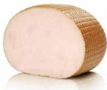
ARROSTO DI TACCHINO BRIVIO MEZZO