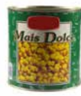
MAIS DOLCE PESO 0,43 kg - IN LATTA