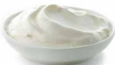
FORMAGGIO SPALMABILE PESO 1 kg