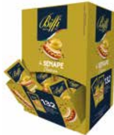
SENAPE IN BUSTINE BIFFI 3199 10 ml - 132 PZ. PER CONFEZIONE