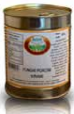
FUNGHI PORCINI TRIFOLATI IN OLIO BELOTTI PESO 0,80 kg - IN LATTA