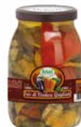
TRIS DI VERDURE GRIGLIATE BELOTTI PESO 1,062 kg - IN VETRO