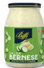
SALSA BERNESE BIFFI 960 ml - VASO