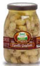
CIPOLLE GRIGLIATE BELOTTI PESO 1,062 kg - IN VETRO