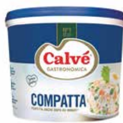
SECCHIELLO MAIONESE COMPATTA CALVÈ 3118 PESO 5 kg