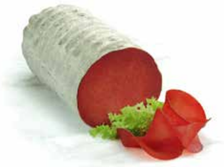
BRESAOLA IGP INTERA