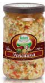
FARCITURA PER TOAST BELOTTI PESO 1,7 kg - IN VETRO