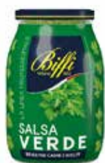
SALSA VERDE BIFFI 1040 ml - VASO