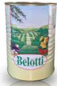
CARCIOFI A SPICCHI AL NATURALE BELOTTI PESO 2,65 kg - IN LATTA