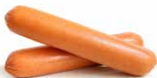
WURSTEL DI POLLO E TACCHINO "AIA" PESO 800 g - 12 PZ. PER CONFEZIONE WURSTEL DI SUINO PRIMOFIORE PESO 1000 g - 12 PZ. PER CONFEZIONE