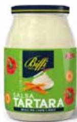
SALSA TARTARA BIFFI 960 ml - VASO