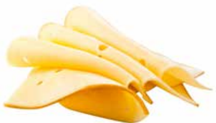
SCAMORZA A FETTE