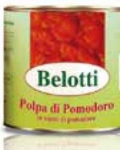
POLPA DI POMODORO BELOTTI PESO 2,65 kg - IN LATTA