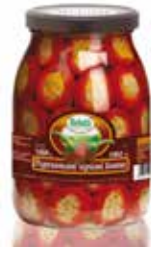
PEPERONCINI FARCITI CON TONNO BELOTTI PESO 1,062 kg - IN VETRO