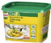
MeP ALLO ZAFFERANO KNORR PESO 0,8 kg