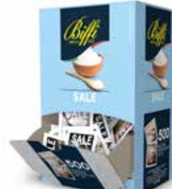
SALE IN BUSTINE BIFFI 3184 1 g - 500 PZ. PER CONFEZIONE