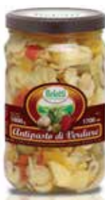
ANTIPASTO DI VERDURE BELOTTI PESO 1,7 kg - IN VETRO