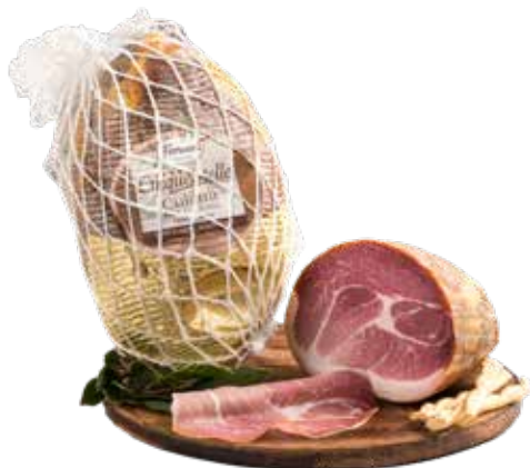
CULATTA CINQUE STELLE MEZZA PESO 1,8 kg