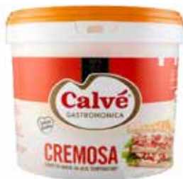
SECCHIELLO MAIONESE CREMOSA CALVÈ 5092 PESO 5 kg