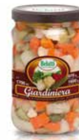
GIARDINIERA BELOTTI PESO 1,7 kg - IN VETRO