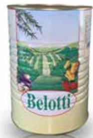
PEPERONI FILETTI GIALLI E ROSSI BELOTTI PESO 4,25 kg - IN LATTA