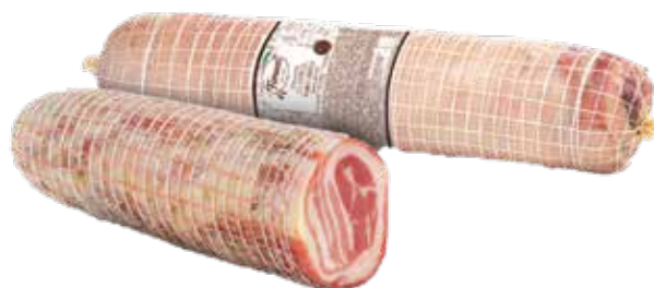
PANCETTA ARROTOLATA SENZA COTENNA MEZZA PESO 2 kg