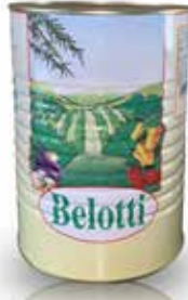
OLIVE VERDI INTERE BELOTTI PESO 4,25 kg - IN LATTA