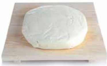
SQUAQUERONE PESO 1 kg