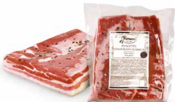
PANCETTA CRUDA STAGIONATA MEZZA PESO 1,8 kg