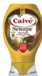
SENAPE CALVÈ 260 ml - FLACONE