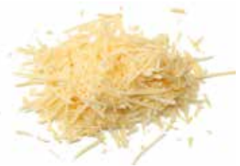
MOZZARELLA TAGLIO JULIENNE SANTORIELLO PESO 2,5 kg