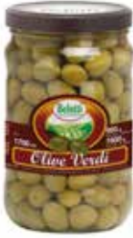
OLIVE VERDI INTERE BELOTTI PESO 1,7 kg - IN VETRO