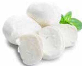
MOZZARELLA VACCINA PESO 100 g - 10 PEZZI