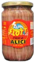
ACCIUGHE IN FILETTI PESO 0,72 kg - IN VETRO