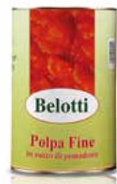
POLPA FINE DI POMODORO BELOTTI PESO 4,25 kg - IN LATTA