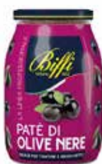
SALSA PATÈ DI OLIVE NERE BIFFI 1000 ml - VASO