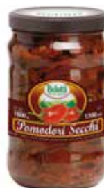
POMODORI SECCHI BELOTTI PESO 1,7 kg - IN VETRO