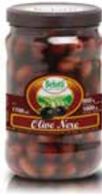
OLIVE NERE INTERE BELOTTI PESO 1,7 kg - IN VETRO