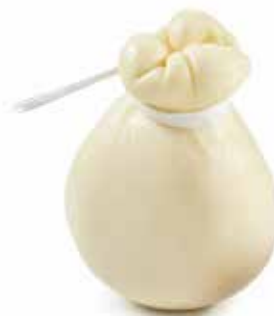
CACIOCAVALLO PESO 1,5 kg