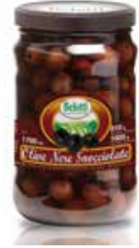
OLIVE NERE SNOCCIOLATE BELOTTI PESO 1,7 kg - IN VETRO