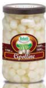
CIPOLLINE BELOTTI PESO 1,7 kg - IN VETRO