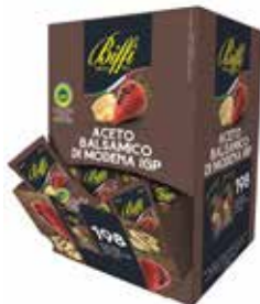
ACETO BALSAMICO IN BUSTINE BIFFI 3183 5 ml - 198 PZ. PER CONFEZIONE