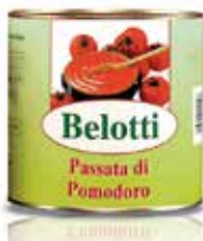
PASSATA DI POMODORO BELOTTI PESO 2,65 kg - IN LATTA