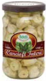
CARCIOFI INTERI BELOTTI PESO 1,7 kg - IN VETRO