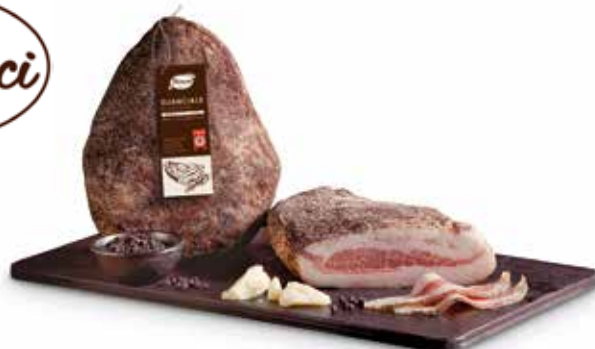
GUANCIALE PESO 1,2 kg