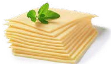
EDAMER A FETTE