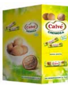
MAIONESE IN BUSTINE CALVÈ 3109 15 ml - 198 PZ - PER CONFEZIONE