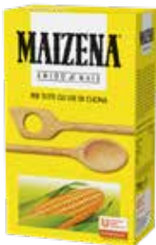
AMIDO DI MAIS MAIZENA PESO 2,5 kg