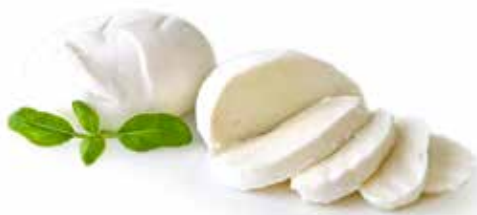
MOZZARELLA BUFALA PESO 125 g - 2 PEZZI