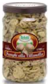
FUNGHI COLTIVATI ALLA VILLANELLA TAGLIATI IN OLIO BELOTTI PESO 1,7 kg - IN VETRO