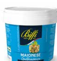
SEC. MAIONESE GASTRONOMICA BIFFI 3162 PESO 5 kg