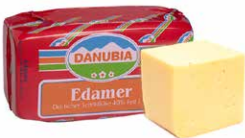
EDAMER DANUBIA INTERO