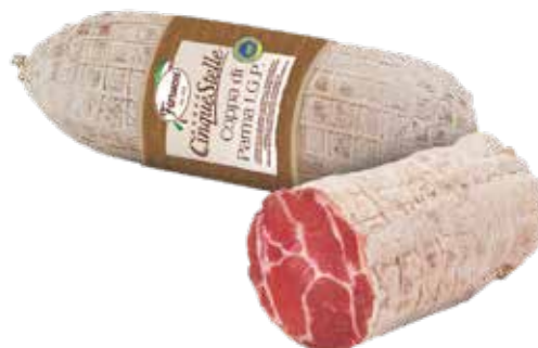
COPPA PARMA IGP CINQUESTELLE