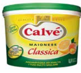
SECCHIELLO MAIONESE CLASSICA CALVÈ 3120 PESO 5 kg