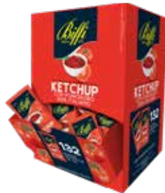
KETCHUP IN BUSTINE BIFFI 3178 10 ml - 132 PZ. PER CONFEZIONE