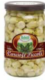
CARCIOFI PICCOLI INTERI BELOTTI PESO 1,7 kg - IN VETRO