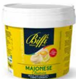
SECCHIELLO MAIONESE BIFFI 2958 PESO 5 kg