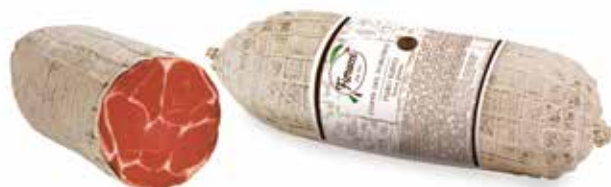
COPPA NOSTRANA NORCINO