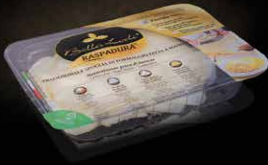
3462 - BELLA LODI RASPADURA PESO 170kg