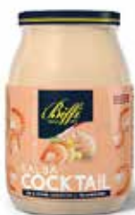
SALSA COCKTAIL BIFFI 960 ml - VASO