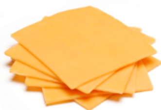
CHEDDAR A FETTE