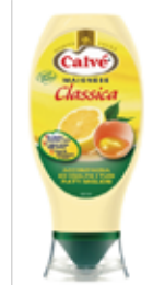
MAIONESE CREMOSA CALVÈ 750 ml - FLACONE