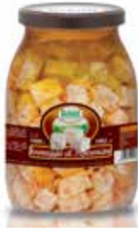
FORMAGGIO AL PEPERONCINO BELOTTI PESO 1,062 kg - IN VETRO