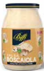
SALSA BOSCAIOLA BIFFI 960 ml - VASO