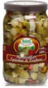
BANDERILLAS BELOTTI PESO 2,02 kg - IN VETRO