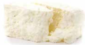
STRACCIATELLA PESO 250 g - 1 PEZZO