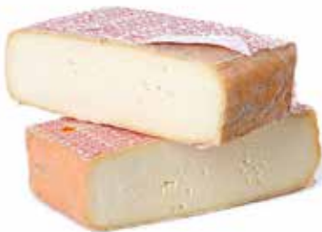
TALEGGIO DOP MALGA BIANCA