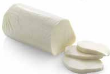
MOZZARELLA FILONI CAMMINO D'ORO FILONE PESO 1 kg