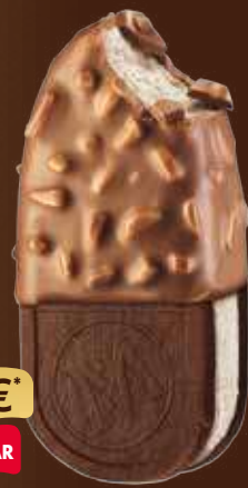
SANDWICH 2.50 €* SOLO AL BAR