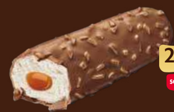
CARAMEL & NUTS 2.30 €* SOLO AL BAR