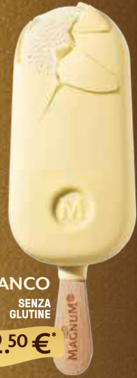
BIANCO SENZA GLUTINE 2.50 €*