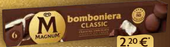
BOMBONIERA SENZA GLUTINE 2.20 €*