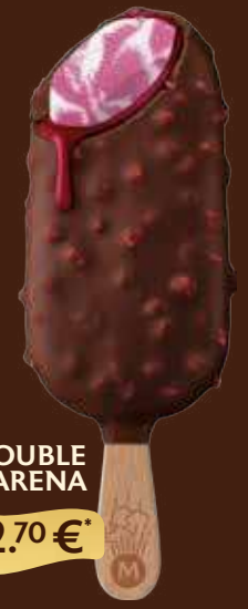
DOUBLE AMARENA 2.70 €*