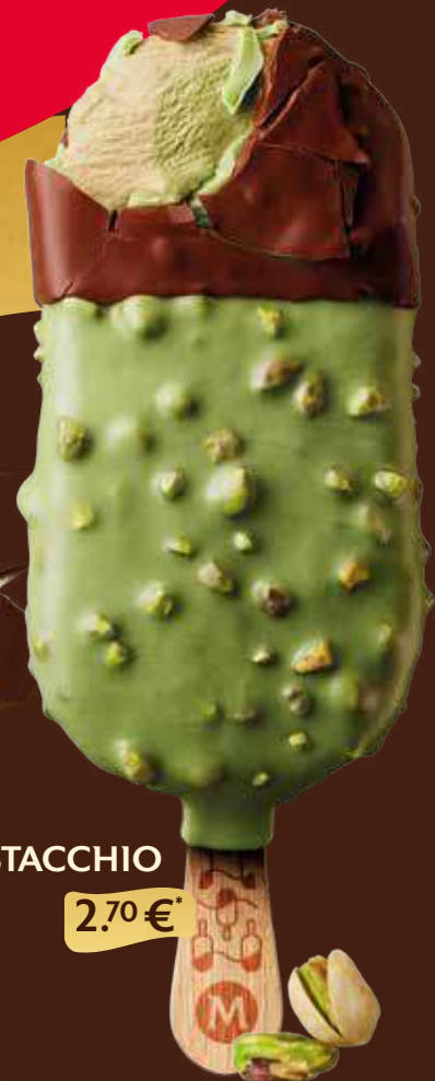
PISTACCHIO 2.70 €*