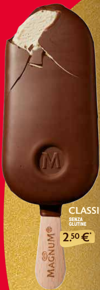
CLASSICO SENZA GLUTINE 2.50 €*