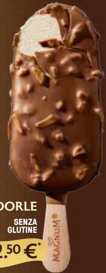
MANDORLE SENZA GLUTINE 2.50 €*