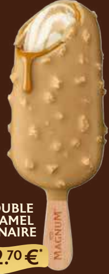
DOUBLE GOLD CARAMEL BILLIONAIRE 2.70 €*