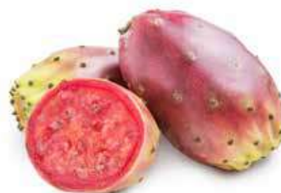
FICHI D'INDIA SICILIANI