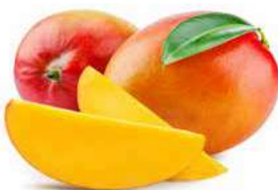
MANGO DI ACIREALE