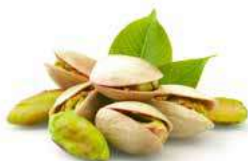
PISTACCHI DI RAFFADALI