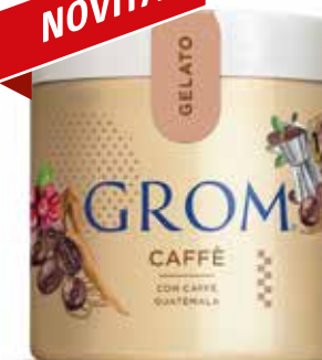
CAFFÈ SPALMABILE con caffè Guatemala