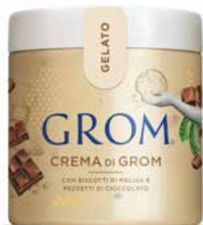
CREMA DI GROM con biscotti di meliga e pezzetti di cioccolato