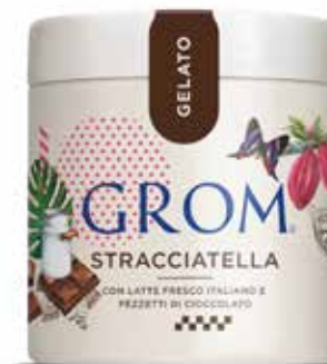
STRACCIATELLA con latte fresco italiano e pezzetti di cioccolato