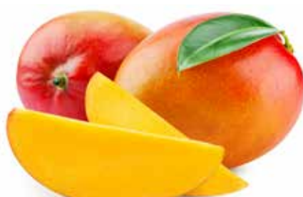
MANGO DI ACIREALE