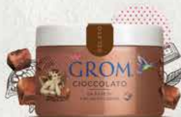
CIOCCOLATO da fave di cacao Ecuador