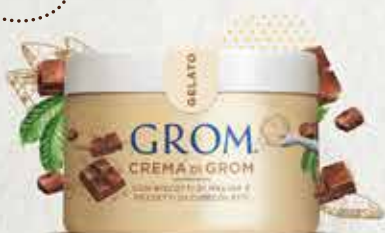
CREMA DI GROM con biscotti di meliga e pezzetti di cioccolato