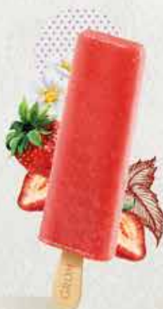
FRAGOLA con il 50% di purea di fragole italiane

I NOSTRI SORBETTI SONO RICCHI DI FRUTTA: PER UN'ESPERIENZA AUTENTICA.