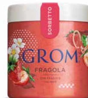
FRAGOLA con fragole italiane