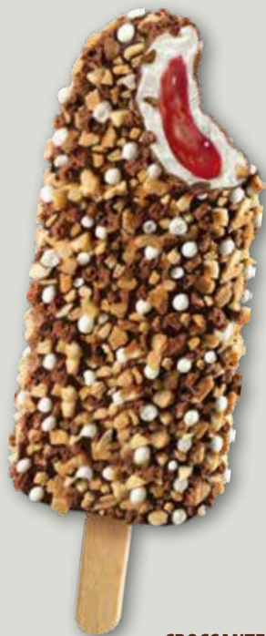
CROCCANTE Ripieno all'amarena!