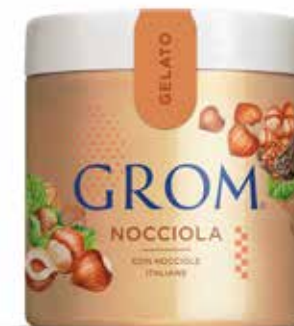
NOCCIOLA con nocciole italiane