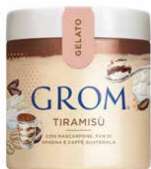
TIRAMISÙ con mascarpone, pan di spagna e caffè Guatemala