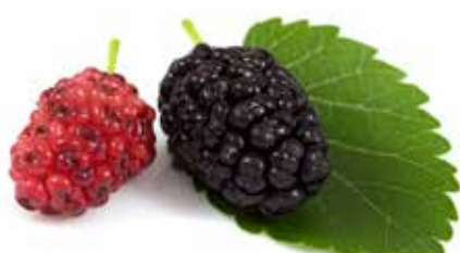
GELSI NERI DELL'ETNA