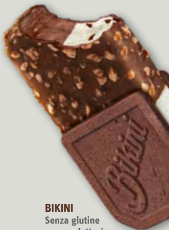
BIKINI Senza glutine e senza lattosio.