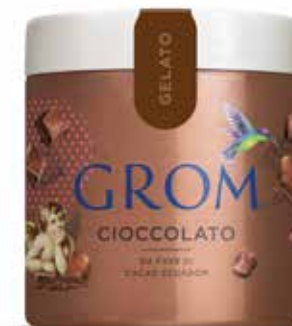
CIOCcolato da fave di cacao Ecuador