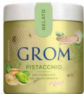
PISTACCHIO con pistacchio del Medio Oriente