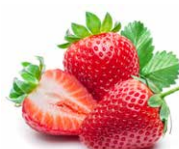
FRAGOLE DI MALETTO

Vellutate scaglette di Spremuta di Frutta e acqua di sorgente, dal gusto intenso, morbido, avvolgente.