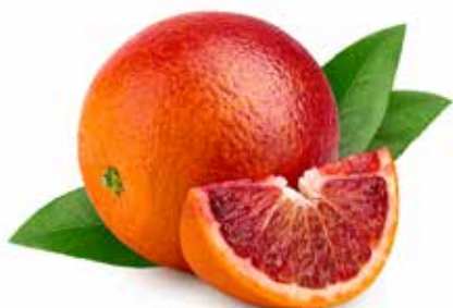
ARANCE ROSSE TAROCCO DI SIRACUSA