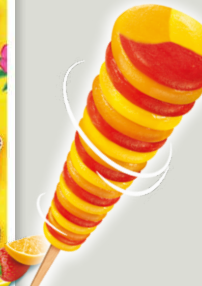
SUPER TWISTER Fantastico al gusto di fragola, limone e arancia. Amato dai bambini per la sua forma e colori!