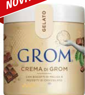
CREMA DI GROM cremosa e spalmabile