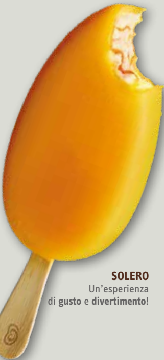
SOLERO Un'esperienza di gusto e divertimento!