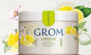
LIMONE con limoni di Sicilia

I NOSTRI SORBETTI SONO RICCHI DI FRUTTA: PER UN'ESPERIENZA AUTENTICA.