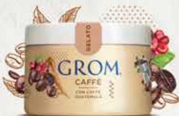
CAFFÈ con caffè Guatemala