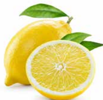
LIMONI GIALLI FEMMINELLO DI SIRACUSA