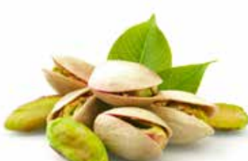
PISTACCHI DI RAFFADALI