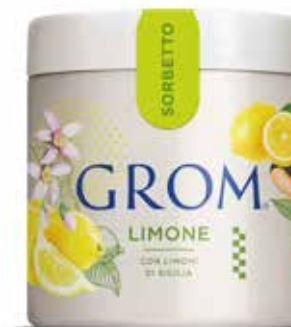
LIMONE con limoni di Sicilia