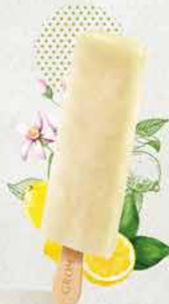
LIMONE con il 26% di succo di Limoni di Sicilia