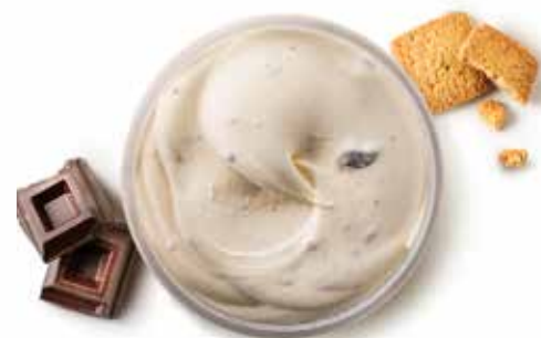
CREMA DI GROM