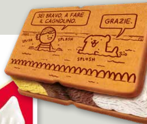
CUCCIOLONE La merenda perfetta, per grandi e piccini. Con latte fresco italiano di alta qualità!