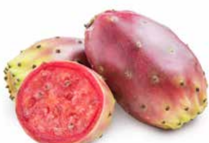
FICHI D'INDIA SICILIANI