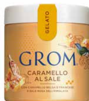
CARAMELLO AL SALE con caramello belga e francese e sale rosa dell'himalaya