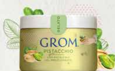
PISTACCHIO con pistacchio del Medio Oriente