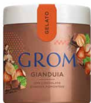
GIANDUIA con cioccolato gianduja piemontese