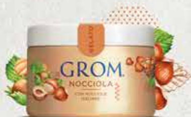
NOCCIOLA con nocciole italiane