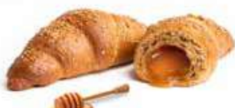
3393 | cereali e miele PESO 80 g - 44 PZ. PER CONFEZIONE