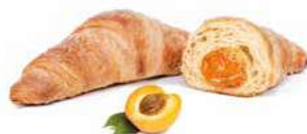
272 | albicocca PESO 90 g - 40 PZ. PER CONFEZIONE