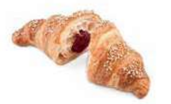
5110 | ribes e melograno PESO 85 g - 50 PZ. PER CONFEZIONE