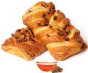
281 | treccia noci pecan PESO 98 g - 40 PZ. PER CONFEZIONE