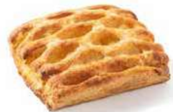
1994 | grigliotto crema mela PESO 110 g - 46 PZ. PER CONFEZIONE