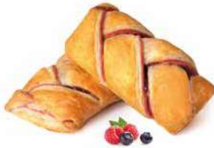
360 | intreccio frutti di bosco PESO 90 g - 55 PZ. PER CONFEZIONE