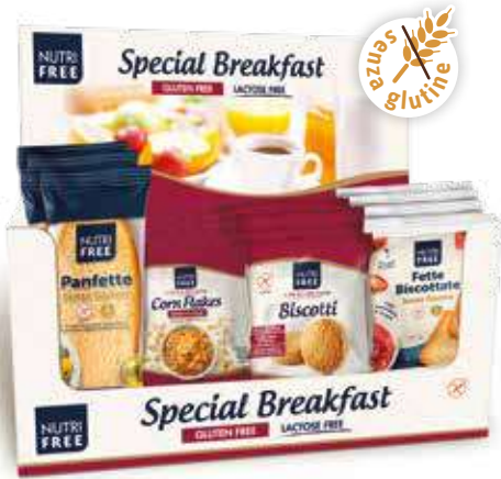
5052 - SPECIAL BREAKFAST PESO 40 g - 18 PZ. PER CONFEZIONE