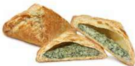
4057 | sfoglia spinaci in camicia con ricotta di montagna PESO 100 g - 20 PZ. PER CONFEZIONE