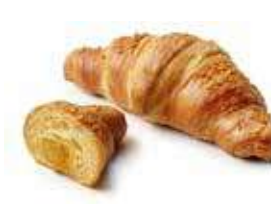
1989 | papaya e mango PESO 90 g - 48 PZ. PER CONFEZIONE