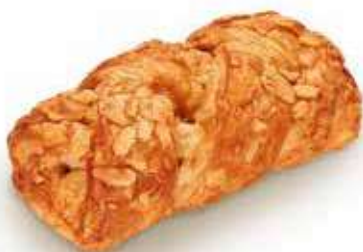
2086 | treccia caramello salato e mandorle PESO 95 g - 48 PZ. PER CONFEZIONE