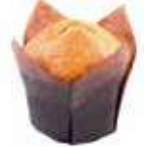
5152 MINI MUFFIN MELA PESO 27 kg - 70 PZ. PER CONFEZIONE