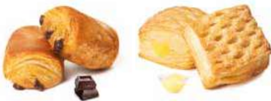
1644 - mini pancioccolato PESO 28 g - 100 PZ. PER CONFEZIONE