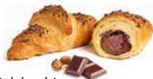
3387 | cioccolato PESO 100 g - 50 PZ. PER CONFEZIONE