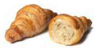
1471 - mini saladino PESO 35 g - 120 PZ. PER CONFEZIONE