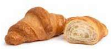
5123 - midi semplice PESO 50 g - 80 PZ. PER CONFEZIONE