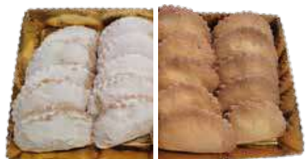
MEZZELUNE ALBICOCCA MEZZELUNE FRUTTI DI BOSCO PESO 33 g - 15 PZ. PER CONFEZIONE