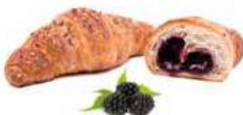
295 | mora PESO 90 g - 40 PZ. PER CONFEZIONE