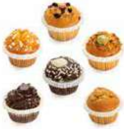
4058 MINI MUFFIN ARTIGIANALI PESO 30 g 30 PZ. PER CONF.