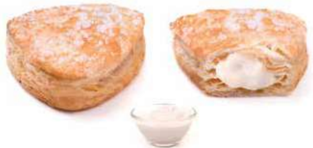
271 | gemma crema di latte PESO 90 g - 55 PZ. PER CONFEZIONE