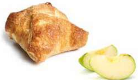
2020 | Sfoglia mele in camicia PESO 100 g - 20 PZ. PER CONFEZIONE