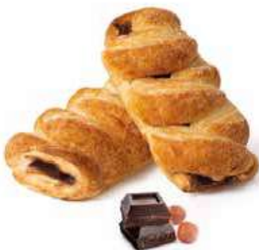
357 | treccia crema di nocciole e cacao magro PESO 85 g - 50 PZ. PER CONFEZIONE