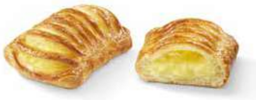
6066 | cestino crema PESO 100 g - 70 PZ. PER CONFEZIONE