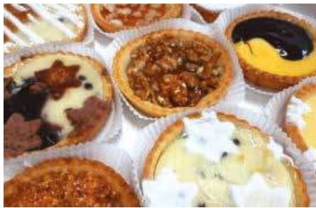
CROSTATINE VARI GUSTI PESO 80 g 12 PZ. PER CONFEZIONE