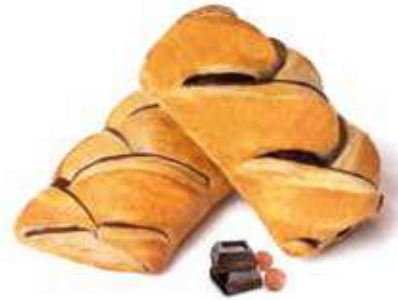
358 | intreccio crema di nocciole e cacao magro PESO 90 g - 55 PZ. PER CONFEZIONE