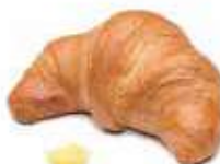
40112 | crema PESO 85 g - 100 PZ. PER CONFEZIONE