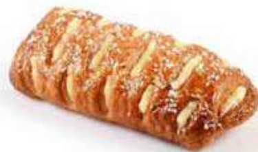
1726 | lemoncino crema limone PESO 80 g - 50 PZ. PER CONFEZIONE