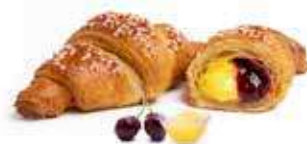
3388 | crema e amarena PESO 100 g - 50 PZ. PER CONFEZIONE