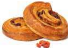
381 - mini girola PESO 35 g - 100 PZ. PER CONFEZIONE