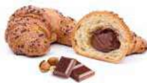
305 | crema di nocciole e cacao magro PESO 80 g - 50 PZ. PER CONFEZIONE