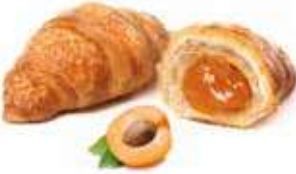
744 - mini chapeau albicocca PESO 40 g - 80 PZ. PER CONFEZIONE