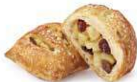
2097 - mini strudelino mele PESO 40 g - 50 PZ. PER CONFEZIONE