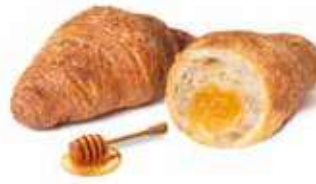
287 - mini croissant cereali e miele PESO 30 g - 100 PZ. PER CONFEZIONE