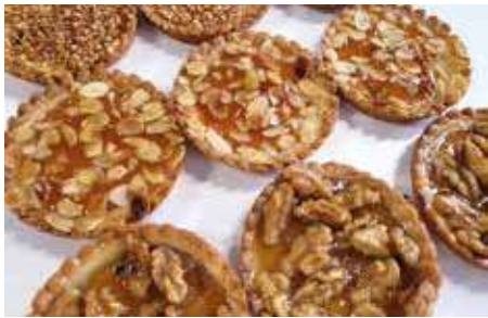
CROSTATINE FRUTTA SECCA ASSORTITE PESO 53 g - 12 PZ. PER CONFEZIONE