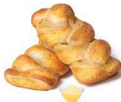
359 | treccia crema PESO 85 g - 50 PZ. PER CONFEZIONE