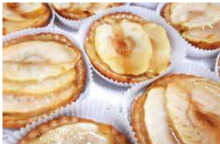
CROSTATINE MELE A VISTA PESO 80 g - 12 PZ. PER CONFEZIONE