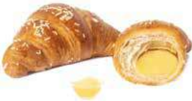
329 | crema PESO 80 g - 50 PZ. PER CONFEZIONE