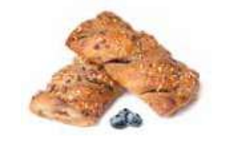
296 | fagotto vegano cereali e mirtilli PESO 75 g - 55 PZ. PER CONFEZIONE