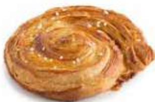
949713 | chiocciola perle di zucchero e crema PESO 120 g - 36 PZ. PER CONFEZIONE