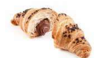
925 | cioccolato PESO 85 g - 50 PZ. PER CONFEZIONE