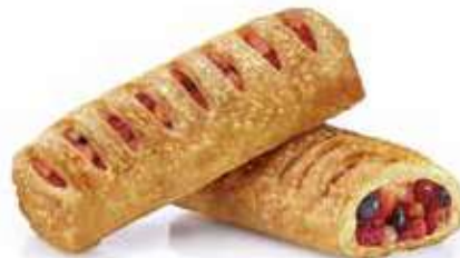
2021 | strudelino frutti di bosco PESO 85 g - 25 PZ. PER CONFEZIONE