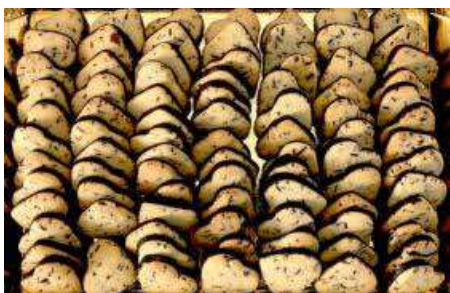
CUORICINI CIOCCOLATO PESO 12 g 85 PZ. PER CONFEZIONE