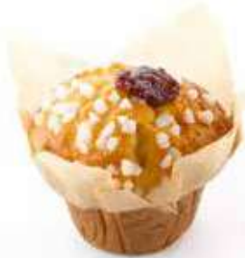
2061 | lampone e limone PESO 112 g - 36 PZ. PER CONFEZIONE