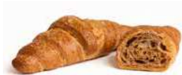
3391 | semplice PESO 70 g - 50 PZ. PER CONFEZIONE

Il sapore genuino delle farine ai cereali unito alla dolcezza della farcitura, regala un'esperienza unica e delicata.