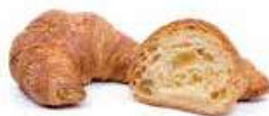
306 | semplice PESO 70 g - 50 PZ. PER CONFEZIONE

Tradizionale cornetto italiano, lievito madre alveolato e profumato.