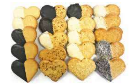
CUORI FARCITI ASSORTITI PESO 85 g 20 PZ. PER CONFEZIONE