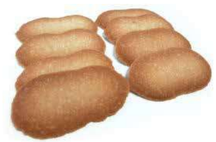
LINGUE DI GATTO PESO 6 g 320 PZ. PER CONFEZIONE