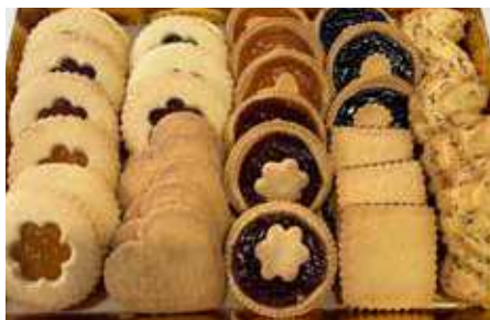
FROLLE ASSORTITE PESO 55 g 32 PZ. PER CONFEZIONE