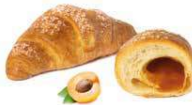
328 | albicocca PESO 80 g - 50 PZ. PER CONFEZIONE