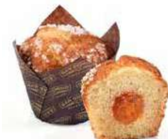
5167 | albicocca PESO 85 g - 20 PZ. PER CONFEZIONE