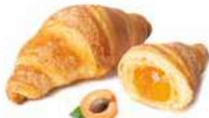
363 - mini croissant albicocca PESO 30 g - 100 PZ. PER CONFEZIONE