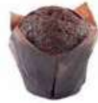
2032 MINI MUFFIN CIOCCOLATO PESO 27 kg - 70 PZ. PER CONFEZIONE