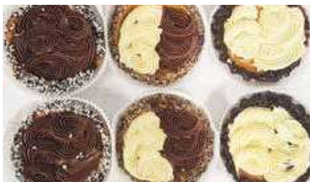
CROSTATINE GIANDUIA PESO 80 g - 12 PZ. PER CONFEZIONE CROSTATINE ASSORTITE PESO 75 g - 12 PZ. PER CONFEZIONE