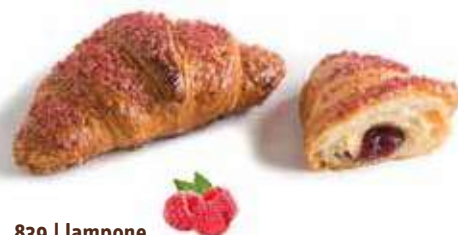
839 | lampone PESO 90 g - 44 PZ. PER CONFEZIONE