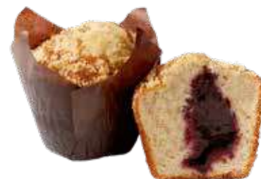
5181 | mirtili PESO 105 g - 20 PZ. PER CONFEZIONE