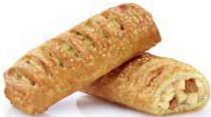
1585 | strudelino mele PESO 85 g - 25 PZ. PER CONFEZIONE