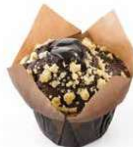
1993 | triplo cioccolato PESO 112 g - 36 PZ. PER CONFEZIONE