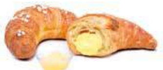
1754 | crema PESO 90 g - 50 PZ. PER CONFEZIONE