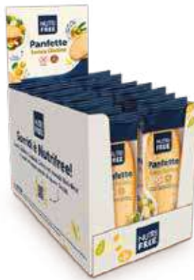
5124 - PANFETTE PESO 75 g - 20 PZ. PER CONFEZIONE