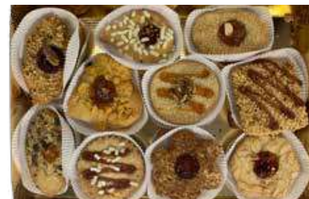
FROLLE DOPPIE ASSORTITE PESO 70 g - 20 PZ. PER CONFEZIONE