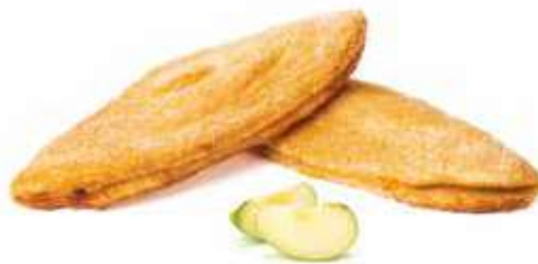
346 | toscanelle alle mele PESO 90 g - 60 PZ. PER CONFEZIONE