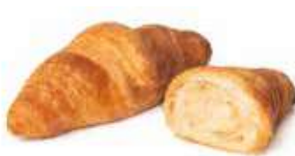
364 - mini croissant semplice PESO 25 g - 100 PZ. PER CONFEZIONE