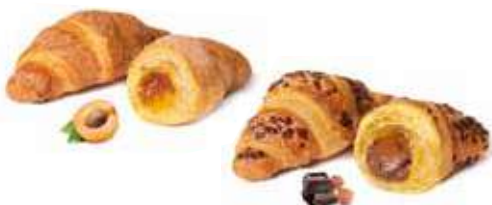
757 - mini croissant mix albicocca e cioccolato PESO 30 g - 50+50 PZ. PER CONFEZIONE