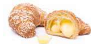
308 | crema PESO 80 g - 50 PZ. PER CONFEZIONE