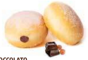
332 MINI BOMBOLINI CIOCCOLATO PESO 25 g - 100 PZ. PER CONFEZIONE