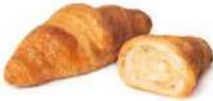
378 - mini chapeau semplice PESO 25 g - 100 PZ. PER CONFEZIONE