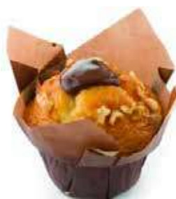
1564 | mela e cannella PESO 112 g - 36 PZ. PER CONFEZIONE