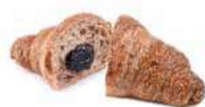
1916 | cereali e frutti rossi PESO 90 g - 44 PZ. PER CONFEZIONE