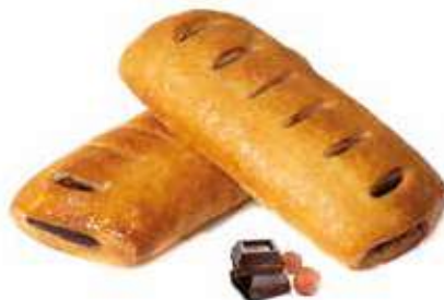
298 | cannolo crema di nocciole e cacao magro PESO 80 g - 50 PZ. PER CONFEZIONE