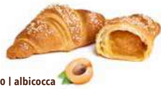
3390 | albicocca PESO 100 g - 50 PZ. PER CONFEZIONE

Dimensione King con 100gr d'impasto, la scelta ideale per una colazione ricca e golosa.