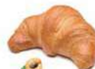
40220 | albicocca PESO 85 g - 100 PZ. PER CONFEZIONE