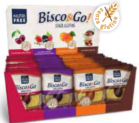
5053 - BISCO & GO! PESO 40 g - 32 PZ. PER CONFEZIONE