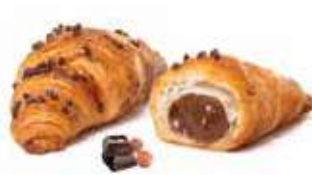
745 - mini chapeau cioccolato PESO 40 g - 80 PZ. PER CONFEZIONE