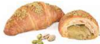
4034 | pistacchio PESO 85 g - 50 PZ. PER CONFEZIONE