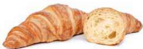
275 | semplice PESO 75 g - 50 PZ. PER CONFEZIONE

Tradizionale cornetto alla francese dall'elegante forma affusolata, per chi ama il sapore intenso e avvolgente dell'impasto al burro.