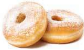
377 MINI CIAMPIÙBELLA PESO 22 g - 65 PZ. PER CONFEZIONE