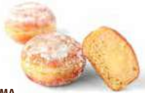
755 MINI BOMBOLINI CREMA PESO 25 g - 100 PZ. PER CONFEZIONE