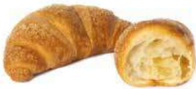
327 | semplice PESO 70 g - 50 PZ. PER CONFEZIONE

Dalla forma corposa e dal soffice impasto, il Buongiorno si vede dal mattino e profuma di cornetto appena sfornato.