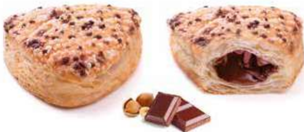
339 | gemma crema di nocciole e cacao magro PESO 90 g - 55 PZ. PER CONFEZIONE