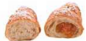
765 - cornetto minimo semplice PESO 40 g - 60 PZ. PER CONFEZIONE 766 - cornetto minimo albicocca PESO 45 g - 60 PZ. PER CONFEZIONE