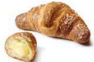
1987 - mini croissant crema PESO 48 g - 72 PZ. PER CONFEZIONE