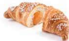
426 | albicocca PESO 85 g - 50 PZ. PER CONFEZIONE