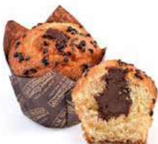
1569 | cioccolato e caramello PESO 112 g - 36 PZ. PER CONFEZIONE