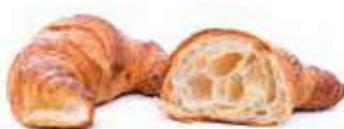
284 | semplice PESO 70 g - 45 PZ. PER CONFEZIONE