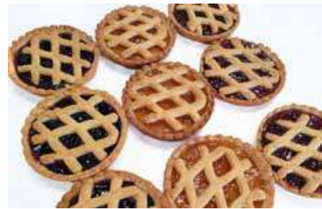
CROSTATINE MARMELLATA ASSORTITE PESO 70 g - 12 PZ. PER CONFEZIONE