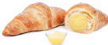
273 | crema PESO 90 g - 40 PZ. PER CONFEZIONE