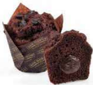
4038 | cioccolato PESO 85 g - 20 PZ. PER CONFEZIONE