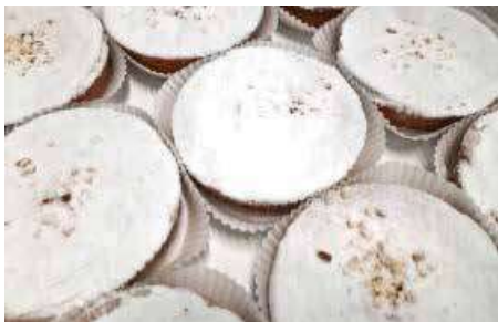
CROSTATINE NONNA PESO 80 g 12 PZ. PER CONFEZIONE