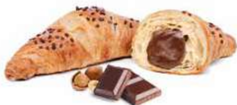
274 | crema di cacao e nocciole PESO 90 g - 40 PZ. PER CONFEZIONE