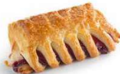
1050 | cresta mascarpone e lamponi PESO 100 g - 45 PZ. PER CONFEZIONE