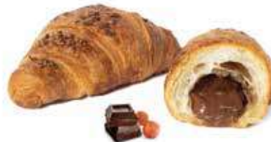
330 | cioccolato PESO 80 g - 50 PZ. PER CONFEZIONE