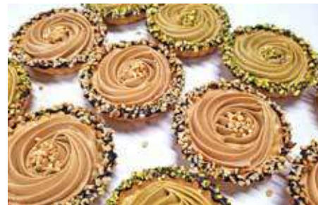
CROSTATINE NOCCIOLA E PISTACCHIO PESO 70 g - 12 PZ. PER CONFEZIONE