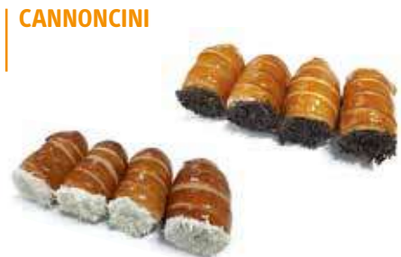
458 - cannoncini mignon gianduia 20117 - cannoncini mignon crema e gianduia PESO 28 g - 36 PZ. PER CONFEZIONE