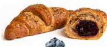
3392 | cereali e mirtillo PESO 80 g - 44 PZ. PER CONFEZIONE