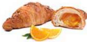
285 | arancia amara PESO 90 g - 40 PZ. PER CONFEZIONE