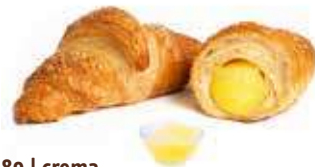
3389 | crema PESO 100 g - 50 PZ. PER CONFEZIONE