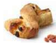
495 | treccina uvetta PESO 75 g - 100 PZ. PER CONFEZIONE