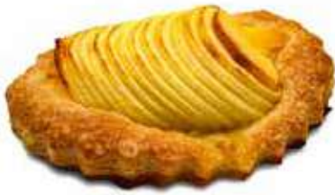
1992 | giromela PESO 100 g - 54 PZ. PER CONFEZIONE