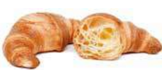
3452 | semplice PESO 85 g - 40 PZ. PER CONFEZIONE

Il Grancornetto, con il suo formato maxi riesce a soddisfare anche le esigenze dei più golosi.