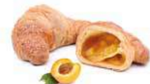
307 | albicocca PESO 85 g - 50 PZ. PER CONFEZIONE