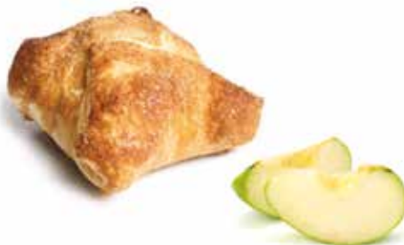
2020 | Sfoggia mele in camicia PESO 100 g - 20 PZ. PER CONFEZIONE