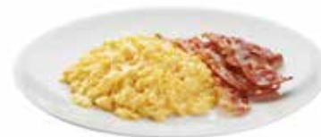
1478 UOVO E BACON