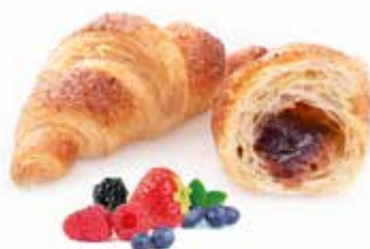
724 | frutti di bosco PESO 80 g - 50 PZ. PER CONFEZIONE