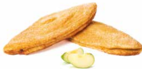
346 | toscanella alle mele PESO 90 g - 60 PZ. PER CONFEZIONE