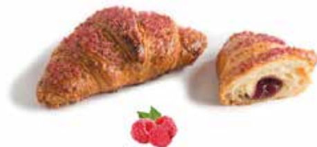
839 | lampone PESO 90 g - 44 PZ. PER CONFEZIONE