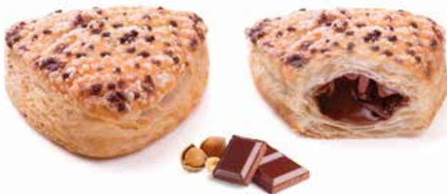
339 | gemma crema di nocciole e cacao magro PESO 90 g - 55 PZ. PER CONFEZIONE