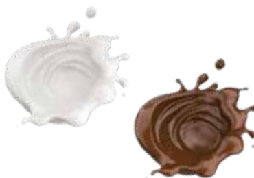
TOPPING CARTE D'OR

3225 amarena - 3226 caramello 3222 cioccolato - 3223 fragola 3227 frutti di bosco - 3229 nocciola 3269 limone - 3270 caramello salato PESO 1 kg - 1 PZ. PER CONFEZIONE