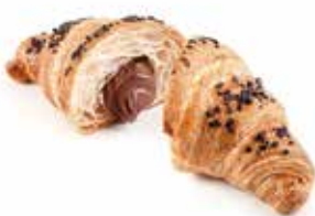
925 | cioccolato PESO 85 g - 50 PZ. PER CONFEZIONE