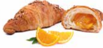
285 | arancia amara PESO 90 g - 40 PZ. PER CONFEZIONE