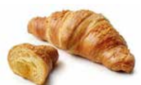
1989 | papaya e mango PESO 90 g - 48 PZ. PER CONFEZIONE