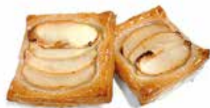
QUADRUCCI MELA A VISTA