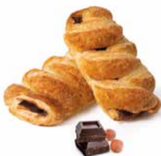
357 | treccia crema di nocciole e cacao magro PESO 85 g - 50 PZ. PER CONFEZIONE