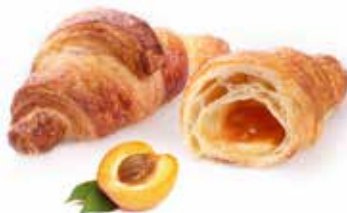
723 | albicocca PESO 80 g - 50 PZ. PER CONFEZIONE