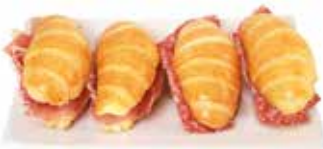
2027 MINI BRIOCHES CRUDO E SALAME