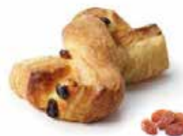
495 | treccina uvetta PESO 75 g - 100 PZ. PER CONFEZIONE