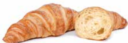
275 | semplice PESO 70 g - 50 PZ. PER CONFEZIONE

Tradizionale cornetto alla francese dall'elegante forma affusolata, per chi ama il sapore intenso e avvolgente dell'impasto al burro.