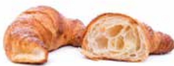
284 | semplice PESO 70 g - 45 PZ. PER CONFEZIONE