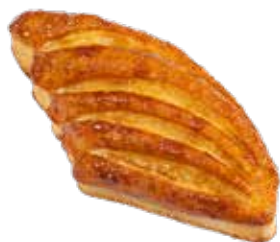
3000 | volo crema catalana PESO 90 g - 24 PZ. PER CONFEZIONE