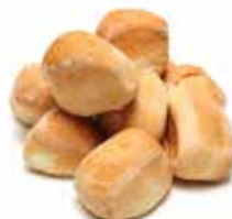
800 MINI CHICCHE DI CIABATTA

PESO 60 g - 24 PZ. PER CONF. - 125 X 125 mm