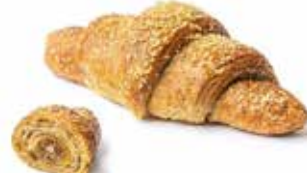
2035 | camomilla e limone PESO 90 g - 48 PZ. PER CONFEZIONE