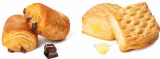
953075 - mini pancioccolato PESO 30 g - 100 PZ. PER CONFEZIONE