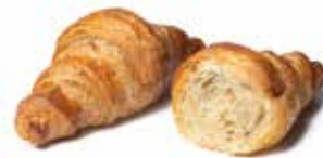
1472 CHAPEAU SALATO