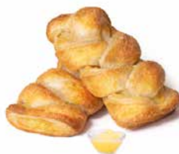
359 | treccia crema PESO 85 g - 50 PZ. PER CONFEZIONE