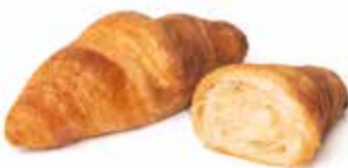
364 - mini croissant semplice PESO 25 g - 100 PZ. PER CONFEZIONE