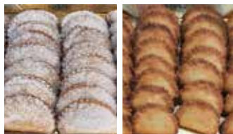
MEZZE LUNE ALBICOCCA