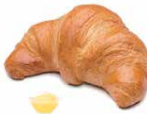
40112 | crema PESO 85 g - 100 PZ. PER CONFEZIONE