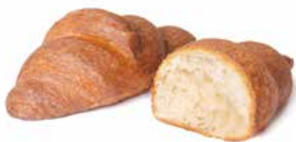
40439 | semplice PESO 80 g - 100 PZ. PER CONFEZIONE

Ideale per chi ama personalizzare, da lievitare per 8-10 h.