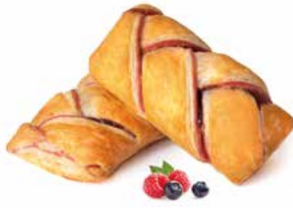
360 | intreccio frutti di bosco PESO 90 g - 55 PZ. PER CONFEZIONE