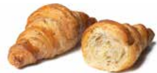
1471 - mini saladino PESO 35 g - 120 PZ. PER CONFEZIONE