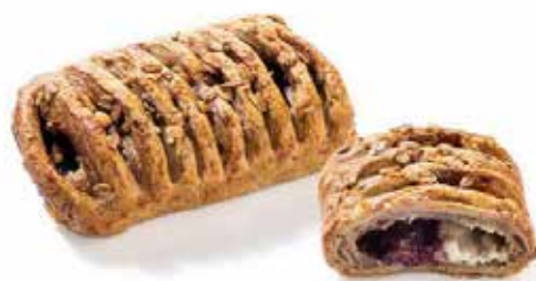
5006 | fagotto cheesecake e mirtili 953135 | fagotto cheesecake e albicocca PESO 98 g - 48 PZ. PER CONFEZIONE