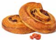
381 - mini girola PESO 35 g - 100 PZ. PER CONFEZIONE