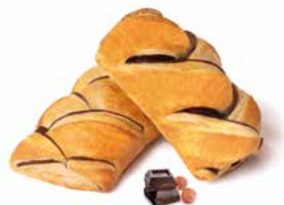
358 | intreccio crema di nocciole e cacao magro PESO 90 g - 55 PZ. PER CONFEZIONE