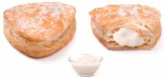
271 | gemma crema di latte PESO 90 g - 55 PZ. PER CONFEZIONE