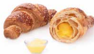
725 | crema PESO 80 g - 50 PZ. PER CONFEZIONE