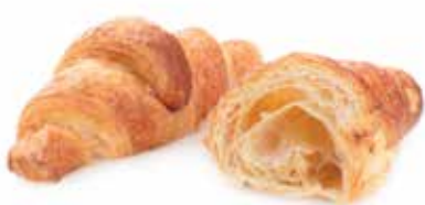
722 | semplice prestige PESO 70 g - 50 PZ. PER CONFEZIONE

La leggerezza e la digeribilità del lievito madre fresco, con il gusto intenso dell'impasto con burro, regalano una colazione ricca e genuina, assecondando tutti i gusti con 5 farciture.