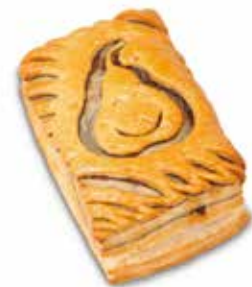
999443 | Sfogliatina pere e cioccolato PESO 95 g - 60 PZ. PER CONFEZIONE