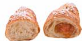
765 - cornetto minimo semplice PESO 40 g - 60 PZ. PER CONFEZIONE