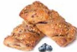
296 | fagotto vegano cereali e mirtilli PESO 75 g - 55 PZ. PER CONFEZIONE