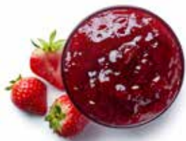
3233 CONFETTURE ALLA FRUTTA