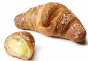
1987 - mini croissant crema PESO 48 g - 72 PZ. PER CONFEZIONE