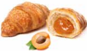
744 - mini chapeau albicocca PESO 40 g - 80 PZ. PER CONFEZIONE