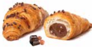
745 - mini chapeau cioccolato PESO 40 g - 80 PZ. PER CONFEZIONE