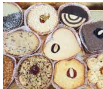
FROLLE DOPPIE MISTO BAR