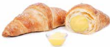
273 | crema PESO 85 g - 40 PZ. PER CONFEZIONE