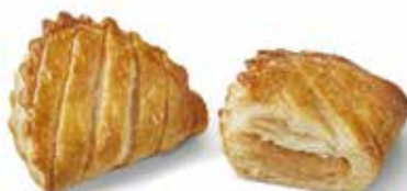
5056 - mini giromela PESO 40 g - 112 PZ. PER CONFEZIONE