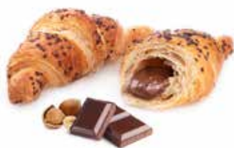
726 | cacao magro e crema di nocciole PESO 80 g - 50 PZ. PER CONFEZIONE