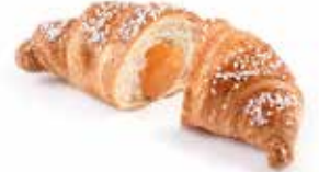
426 | albicocca PESO 85 g - 50 PZ. PER CONFEZIONE