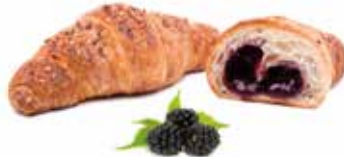
295 | mora PESO 90 g - 40 PZ. PER CONFEZIONE