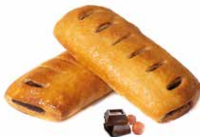
298 | cannolo crema di nocciole e cacao magro PESO 75 g - 50 PZ. PER CONFEZIONE