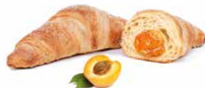
272 | albicocca PESO 85 g - 40 PZ. PER CONFEZIONE