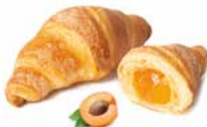
363 - mini croissant albicocca PESO 30 g - 100 PZ. PER CONFEZIONE