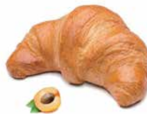
40220 | albicocca PESO 85 g - 100 PZ. PER CONFEZIONE