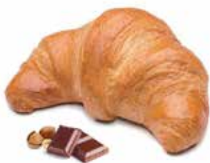
40226 | cioccolato PESO 85 g - 100 PZ. PER CONFEZIONE