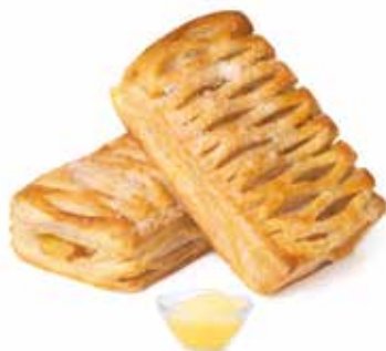
344 | delizia alla crema PESO 75 g - 50 PZ. PER CONFEZIONE