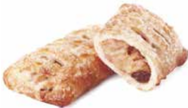
1960 | strudelino mele PESO 80 g - 75 PZ. PER CONFEZIONE 2021 | strudelino frutti di bosco PESO 85 g - 25 PZ. PER CONFEZIONE