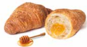
287 - mini croissant cereali e miele PESO 30 g - 100 PZ. PER CONFEZIONE