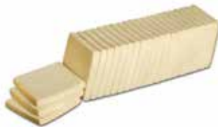
553 TOAST SENZA BORDO

PESO 60 g - 24 PZ. PER CONF. - 125 X 125 mm