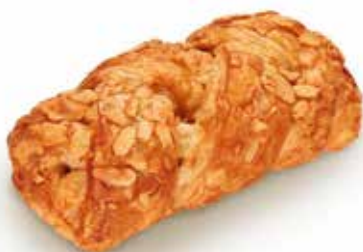
2086 | treccia caramello salato e mandorle PESO 95 g - 48 PZ. PER CONFEZIONE