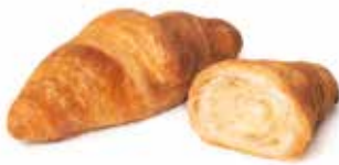
378 - mini chapeau semplice PESO 25 g - 100 PZ. PER CONFEZIONE