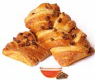
281 | treccia noci pecan PESO 98 g - 40 PZ. PER CONFEZIONE