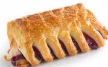
1050 | cresta mascarpone e lamponi PESO 100 g - 45 PZ. PER CONFEZIONE