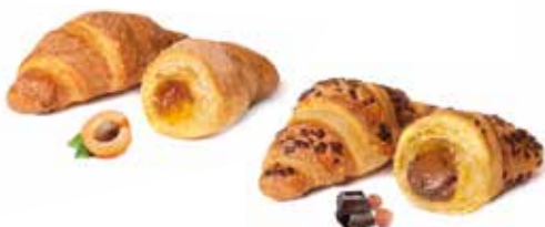
757 - mini croissant mix albicocca e cioccolato PESO 30 g - 50+50 PZ. PER CONFEZIONE