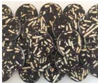
FETTE SALAME DI CIOCCOLATO