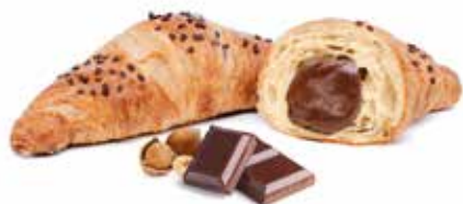
274 | crema di cacao e nocciole PESO 85 g - 40 PZ. PER CONFEZIONE