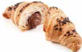
925 | cioccolato PESO 85 g - 50 PZ. PER CONFEZIONE