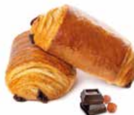
276 | pain au chocolat PESO 70 g - 50 PZ. PER CONFEZIONE