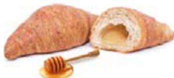
375 | cereali e miele PESO 75 g - 55 PZ. PER CONFEZIONE