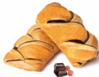
358 | intreccio crema di nocciole e cacao magro PESO 90 g - 55 PZ. PER CONFEZIONE