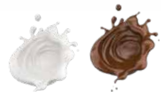
TOPPING CARTE D'OR PESO 1 kg - 1 PZ. PER CONF. 3225 amarena 3226 caramello 3222 cioccolato