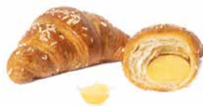
329 | crema