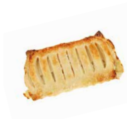
412 | strudel alle mele PESO 80 g - 50 PZ. PER CONFEZIONE