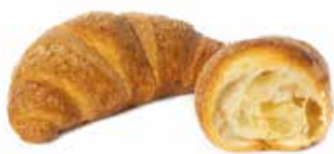
327 | semplice

Dalla forma corposa e dal soffice impasto, il Buongiorno si vede dal mattino e profuma di cornetto appena sfornato.