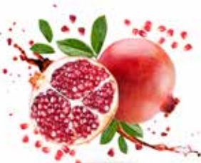
SUCCOBENE ACHILLEA VEDI PAG. 42