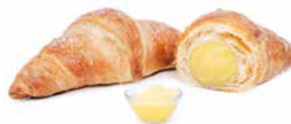
273 | crema PESO 85 g - 40 PZ. PER CONFEZIONE