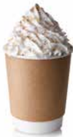
3221 PANNA SPRAY PESO 0,7 kg 1 PZ. PER CONFEZIONE