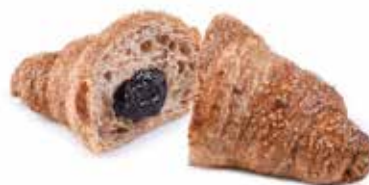
2999 | cereali frutti rossi