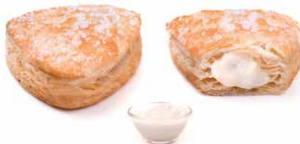
271 | gemma crema di latte PESO 90 g - 55 PZ. PER CONFEZIONE