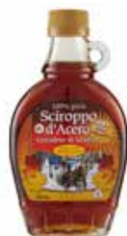
3267 SCIROPPO D'ACERO PESO 250 g 1 PZ. PER CONFEZIONE