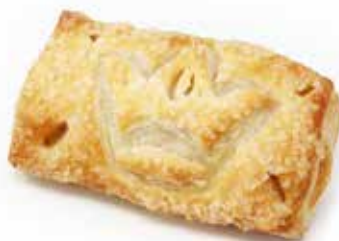
5005 | mela reale PESO 80 g - 70 PZ. PER CONFEZIONE