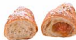
765 - cornetto minimo semplice PESO 40 g - 60 PZ. PER CONFEZIONE