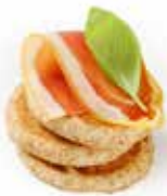
3266 TIGELLE EMILIANE PESO 16 g 16 PZ. PER CONFEZIONE