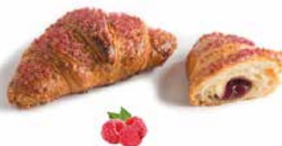
839 | lampone PESO 90 g - 44 PZ. PER CONFEZIONE