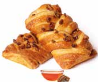
281 | treccia noci pecan PESO 98 g - 40 PZ. PER CONFEZIONE