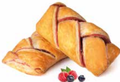
360 | intreccio frutti di bosco PESO 90 g - 55 PZ. PER CONFEZIONE