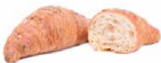
383 | semplice PESO 65 g - 55 PZ. PER CONFEZIONE

Il sapore genuino delle farine ai cereali unito alla dolcezza della farcitura, regalal un'esperienza unica e delicata.