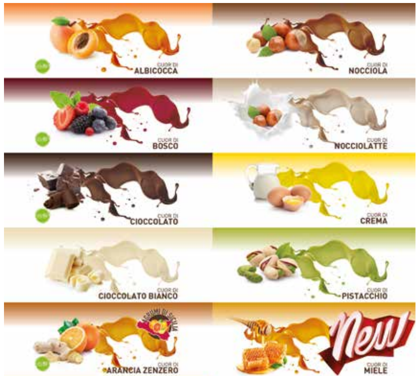
FARCITURE CREAMI PESO 1,4 kg - 2 pezzi