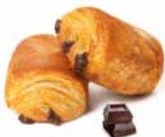
380 - mini pancioccolato PESO 30 g - 100 PZ. PER CONFEZIONE