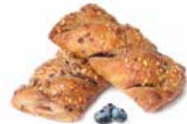
296 | fagotto vegano cereali e mirtilli PESO 75 g - 55 PZ. PER CONFEZIONE