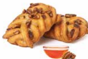
729 - mini treccia noci pecan PESO 40 g - 96 PZ. PER CONFEZIONE