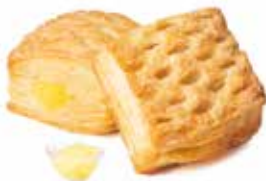
371 - mini delizie crema PESO 30 g - 140 PZ. PER CONFEZIONE