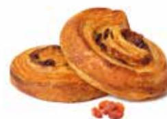
381 - mini girola PESO 35 g - 100 PZ. PER CONFEZIONE