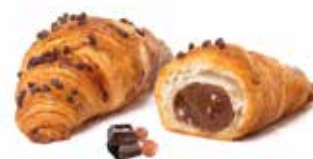
745 - mini chapeau cioccolato PESO 40 g - 80 PZ. PER CONFEZIONE