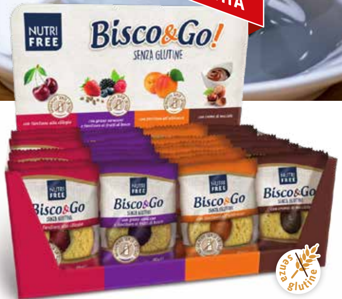
5053 - BISCO & GO! PESO 40 g - 32 PZ. PER CONFEZIONE