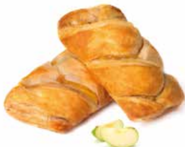
330 | intreccio mele PESO 90 g - 55 PZ. PER CONFEZIONE