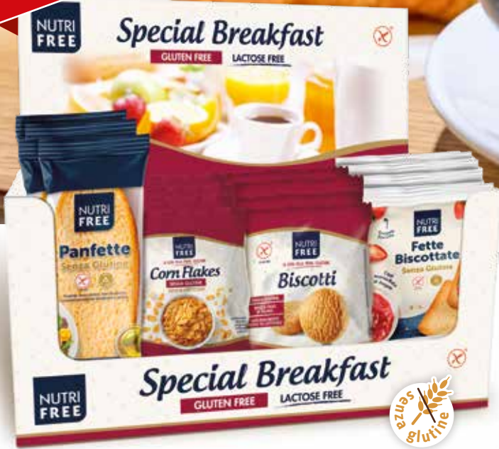
5052 - SPECIAL BREAKFAST PESO 40 g - 18 PZ. PER CONFEZIONE