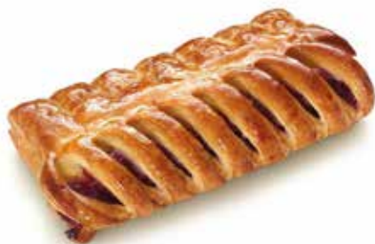
1050 | cresta mascarpone e lamponi PESO 100 g - 45 PZ. PER CONFEZIONE