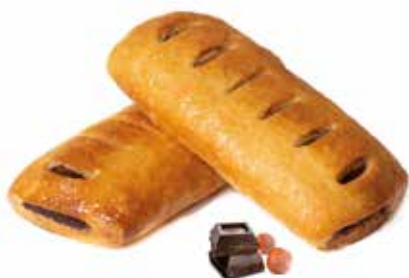
298 | cannolo crema di nocciole e cacao magro PESO 75 g - 50 PZ. PER CONFEZIONE