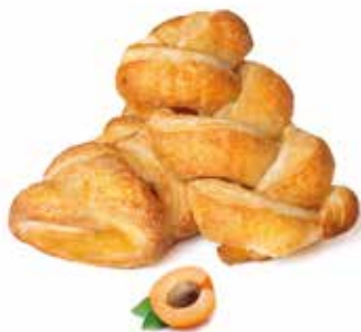
338 | treccia albicocca PESO 85 g - 50 PZ. PER CONFEZIONE