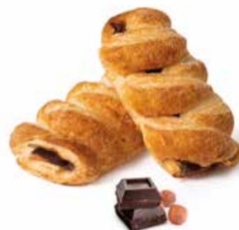
357 | treccia crema di nocciole e cacao magro PESO 85 g - 50 PZ. PER CONFEZIONE