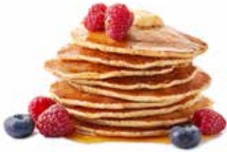
784 - PANCAKE 10 CM Ø - 40 PZ. PER CONFEZIONE