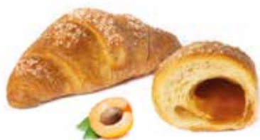
328 | albicocca