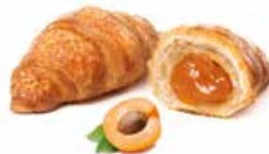
744 - mini chapeau albicocca PESO 40 g - 80 PZ. PER CONFEZIONE