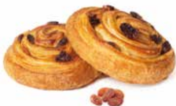
280 | girolapiù PESO 100 g - 40 PZ. PER CONFEZIONE