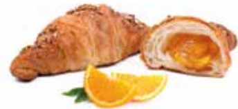
285 | arancia amara PESO 90 g - 40 PZ. PER CONFEZIONE