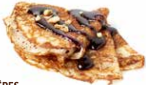
783 - CRÊPES 30 CM Ø - 40 PZ. PER CONFEZIONE