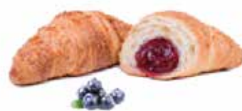
382 | cereali e mirtillo PESO 75 g - 70 PZ. PER CONFEZIONE