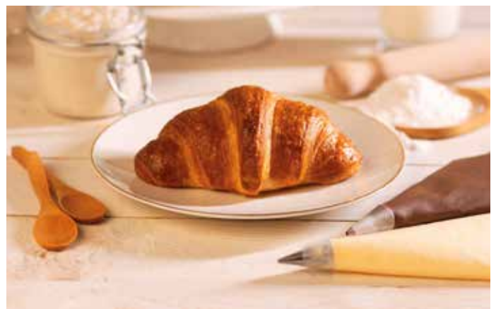
266 | cacao e crema di nocciole PESO 65 g - 50 PZ. PER CONFEZIONE