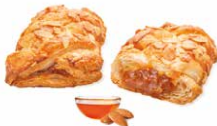
746 | treccia gourmet caramello salato e mandorle PESO 80 g - 52 PZ. PER CONFEZIONE