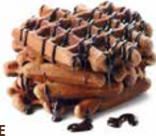
618 - WAFFLE PESO 115 g - 50 PZ. PER CONFEZIONE