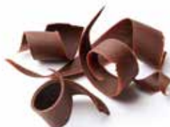
GUARNIZIONI VEDI PAG. 14