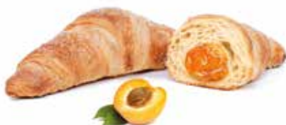
272 | albicocca PESO 85 g - 40 PZ. PER CONFEZIONE