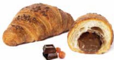
330 | cioccolato