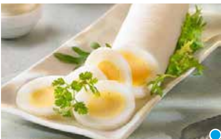
UOVO LUNGO SODO AFFETTATO PESO 300 g - 10 PZ. PER CONF.