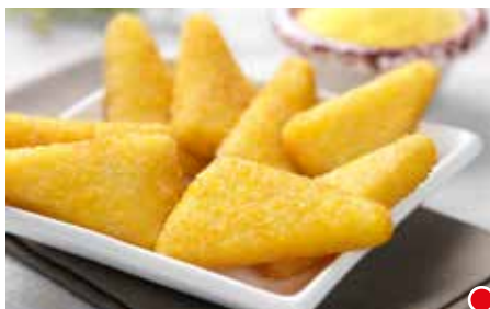
SCAGLIOZZI DI POLENTA CON PANATURA CROCCANTE PESO 5 kg - 250 PZ. PER CONF.