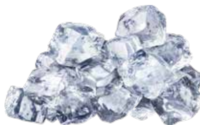
CUBETTI DI GHIACCIO PESO 12 kg - 6 BUSTE PER CONF.