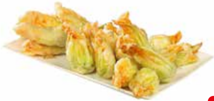
FIORI DI ZUCCHINA PASTELLATI PESO 1 kg - 50 PZ. PER CONFEZIONE