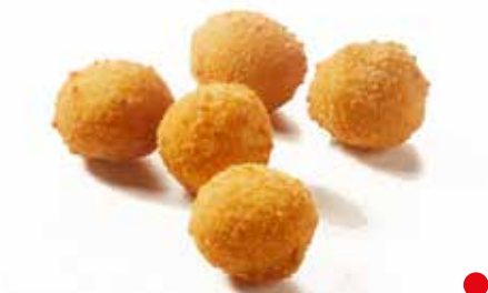
MOZZARELLINE PANATE PREFRITE PESO 5 kg - 280 PZ. PER CONFEZIONE