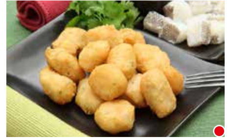
BOCCONCINI DI BACCALÀ PESO 5 kg - 250 PZ. PER CONFEZIONE