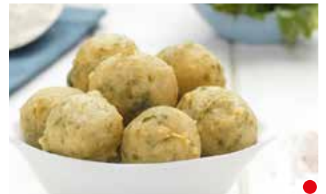
FRIITELLE ALLE ALGHE PESO 3 kg - 200 PZ. PER CONF.