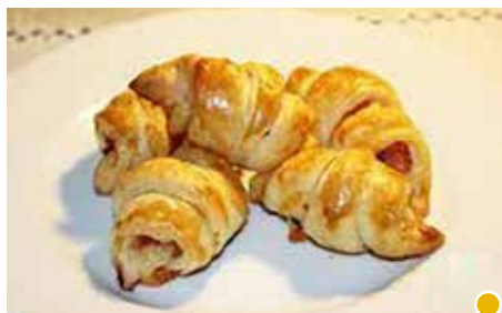
CORNETTINI SALATI PROSC. COTTO E FORMAGGIO