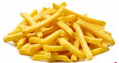
PATATINE DA FORNO PESO 12,5 kg - 5 BUSTE