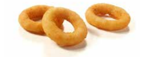
ANELLI DI CIPOLLA PASTELLATI PESO 1 kg - 40 PZ. PER CONFEZIONE