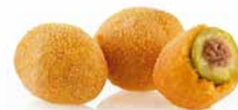
OLIVE ASCOLANE PREFRITE PESO 5 kg - 200 PZ. PER CONFEZIONE