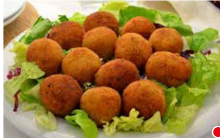
CROCCHETTINE HAPPY FISH PESO 6 kg - 300 PZ. PER CONFEZIONE