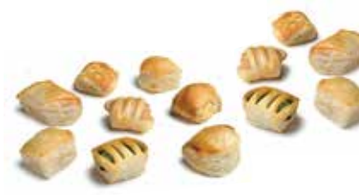
SALATINI MICRO 7 GUSTI

PESO 4 kg - 200 PZ. PER CONF. SALATINI RUSTICI ASSORTITI PESO 5 kg - 250 PZ. PER CONF.