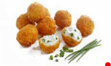
PHILADELPHIA SNACKS PESO 1 kg - 50 PZ. PER CONFEZIONE