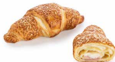
CORNETTO SALATO PROSC. COTTO e FORMAGGIO

PESO 125 g - 24 PZ. PER CONFEZIONE 135 x 85 mm