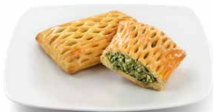
BELLAVISTA RICOTTA E SPINACI