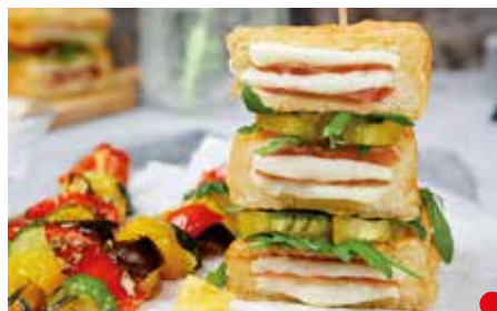
TRAMEZZINO SPECK E PROVOLA PESO 110 g - 36 PZ. PER CONFEZIONE