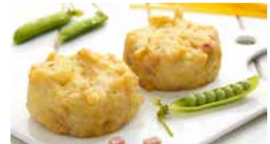
FRITTATINA DI SPAGHETTI PESO 5 kg - 200 PZ. PER CONFEZIONE