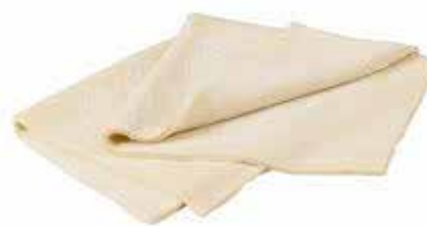
PASTA SFOGLIA CON BURRO 10 FOGLI STESI 40x30 cm - 5 kg