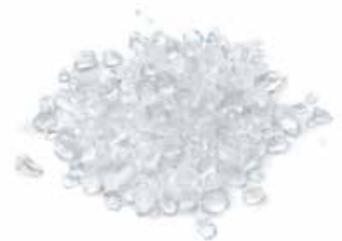
GHIACCIO TRITATO PESO 12 kg - 6 BUSTE PER CONF.