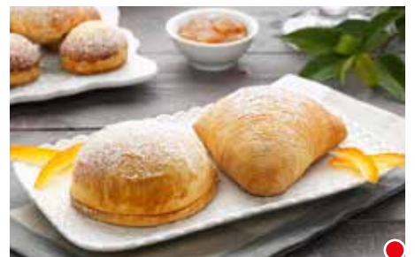
SFOGLIATELLA FROLLA SFOGLIATELLA RICCIA PESO 130 g - 45 PZ. PER CONFEZIONE