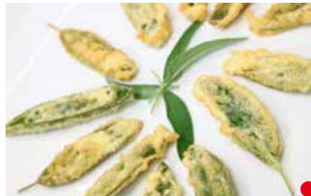
SALVIA PASTELLATA PESO 1 kg - 50 PZ. PER CONFEZIONE