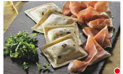
BARTOLACCI ALLO SQUACQUERONE E PIADINA PESO 36 g - 82 PZ. PER CONF. - 3 kg