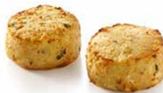
100 g GRATIN FUNGHI GRATIN MOZZ. POMODORO GRATIN BROCCOLI GRATIN TARTIFLETTE BACON PESO 1,5 kg - 15 PZ. PER CONFEZIONE