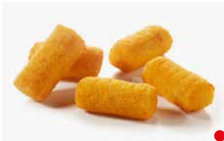
CROCCHETTE PATATE DA FORNO PESO 10 kg - 4 BUSTE PER CONF.