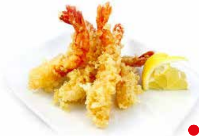
CODE DI GAMBERO IN PASTELLA PREFRITTI PESO 1 kg - 40 PZ. PER CONFEZIONE