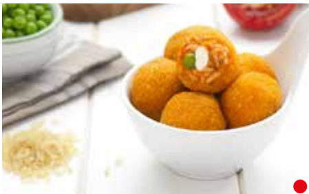
ARANCINI DI SUGO MIGNON PESO 5 kg - 200 PZ. PER CONFEZIONE