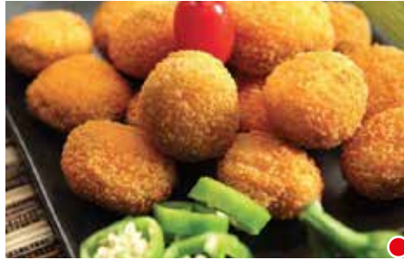
JALABITE PESO 21 g - 3 kg 142 PZ. PER CONFEZIONE