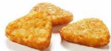
TRIANGOLINI ROSTI PATATE E CIPOLLE PESO 2,5 kg (25 g) 100 PZ. PER CONF.