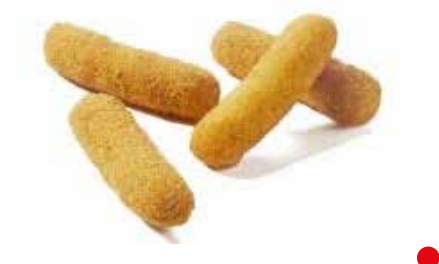
FAGOTTINO AL FORMAGGIO PESO 2x2,5 kg (25 g) 200 PZ. PER CONFEZIONE