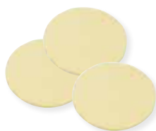
DISCHI SFOGLIA PESO 5 kg - 500 PZ. PER CONF.