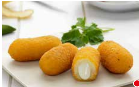
CROCCHÈ CON MOZZARELLINE MIGNON PESO 5 kg - 200 PZ. PER CONFEZIONE