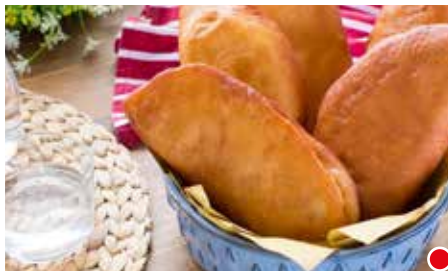
CALZONI ALLA PIZZAIOLA CALZONI AL PROSCIUTTO E MOZZARELLA