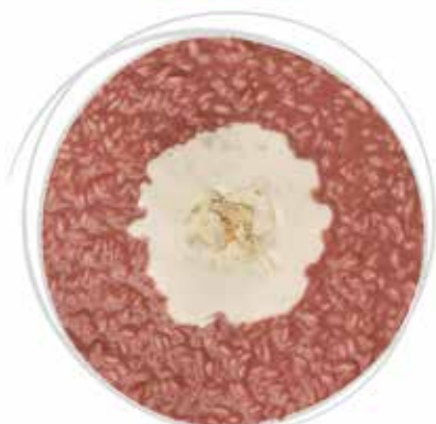
1807 GRAN RISOTTO AL "BAROLO DOCG" CON "CASTELMAGNO DOP" PESO 270 g 5 BUSTE