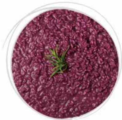
1823 GRAN RISOTTO ALL'AMARONE PESO 300 g 5 BUSTE