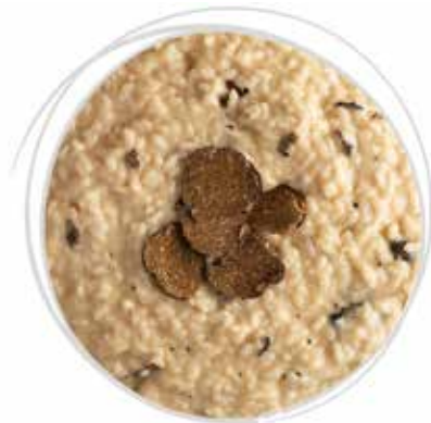
1821 GRAN RISOTTO AL TARTUFO E BOLLICINE PESO 270 g 5 BUSTE