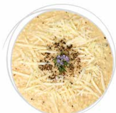
1809 GRAN RISOTTO CACIO E PEPE PESO 270 g 5 BUSTE