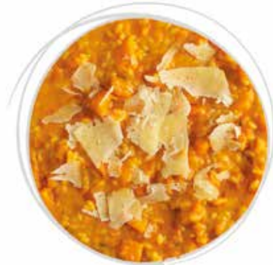
1820 GRAN RISOTTO ALLA ZUCCA E FORMAGGIO BAGOSS PESO 270 g 5 BUSTE