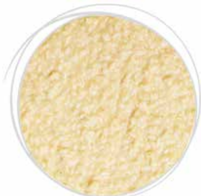
1813 GRAN RISOTTO ALLA PARMIGIANA (Parmigiano Reggiano) PESO 270 g 5 BUSTE