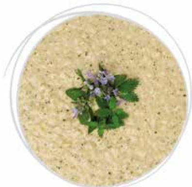
1808 GRAN RISOTTO AI SAPORI D'ALPEGGIO PESO 270 g 5 BUSTE