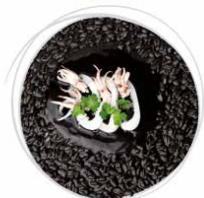
1810 GRAN RISOTTO AL NERO DI SEPIE CON SEPIE E CALAMARI PESO 270 g 5 BUSTE