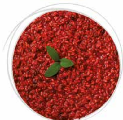
1842 GRAN RISOTTO ALLA BARBABIETOLA CON CREMA DI RICOTTA E PARMIGIANO REGGIANO PESO 300 g 5 BUSTE