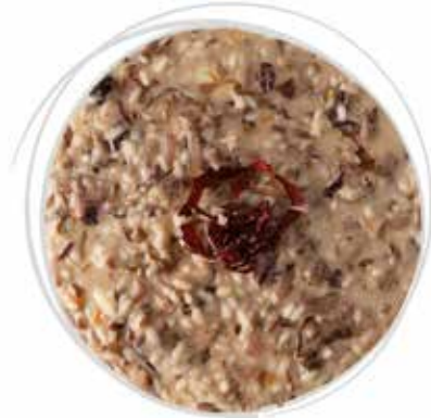
1818 GRAN RISOTTO AL RADICCHIO DI VERONA IGP E SCAMORZA PESO 270 g 5 BUSTE